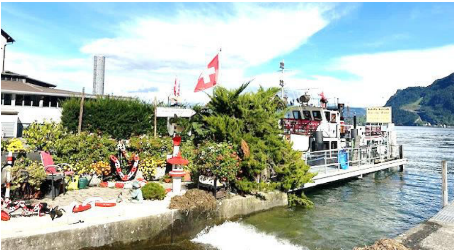
Das Restaurant lag direkt am See