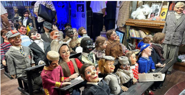
Sahen auf den ersten Blick fast echt aus: Puppen in der Dream Factory

Bemerkenswert im Rahmen des Treffens ist die Galaveranstaltung, die in einem Rahmen stattfindet, der sich jeder Kategorisierung entzieht: Die «Dream Factory», bei der wir zu Gast sind, präsentiert einen Parcours, der sich durch mehrere Räume schlängelt, entlang dessen man in die unterschiedlichsten Sammlerstücke eintaucht und oft von ihnen überwältigt wird: Marionetten jeder Größe und Beschaffenheit weichen kurz darauf unzähligen ordentlich aufgereihten und beleuchteten Krippenhäuschen; einige Automodelle wechseln sich ab mit typischen Erinnerungsstücken aus der Welt der Illusion; Plakate, Puppen, Bühnenkostüme, sogar historische Ausgaben von Lego-Boxen. Wir kommen im Bankettsaal an, und trotz völliger Alkoholabstinenz, schwirrt uns schon der Kopf und wir stellen uns alle die gleiche Frage: Was kann einen so starken Drang ausgelöst haben, so viele und so unterschiedliche Objekte zu sammeln und sie, einmal gesammelt, auch auszustellen? Was ist das verbindende Element, abgesehen von der allgemeinen Vorherrschaft des Fantastischen und der Überhöhung der Realität? Auch die während des Banketts gebotenen Shows, die neben den deutschen Dialogen, die leider für uns völlig unverständlich waren und unterhaltsame Verwandlungskunst und Illusionismus umfassten, beantworteten diese Frage nicht.