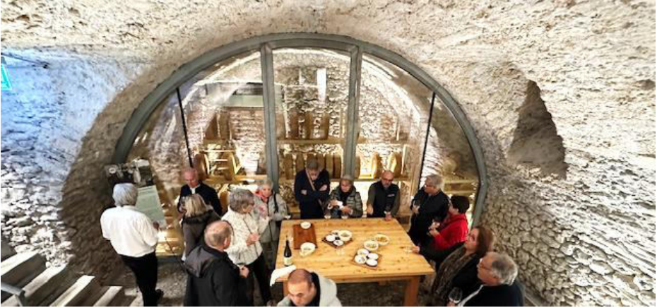
Beim Apéro im stimmungsvollen urchigen Keller

Getränkeflaschen mit suspekt farbigen Inhalten ging es über eine nicht SUVA-konforme – für die betagten Topianer etwas mühsam – jahrhunderte alte Granittreppenstiege in einen Käselager-Keller.