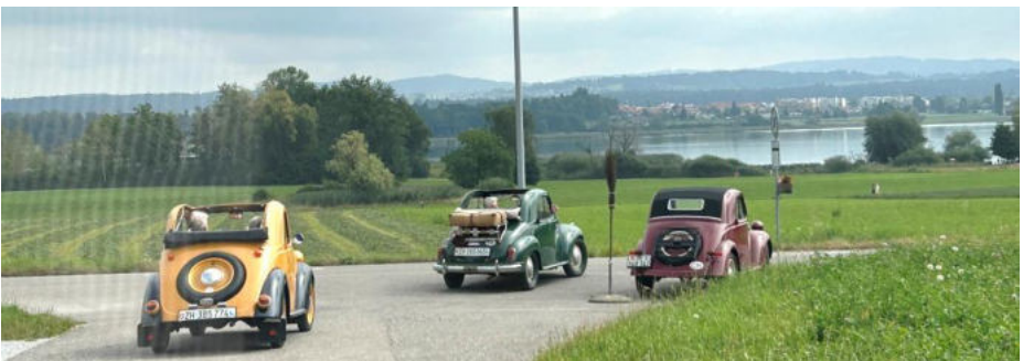
Abfahrt Richtung Picknickplatz