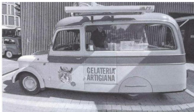
Uno splendido FIAT 1100 Industriale ( carrozzeria di derivazione 103 su telaio separato pre-103) ha accolto i partecipanti distribuendo gelati artigianali.