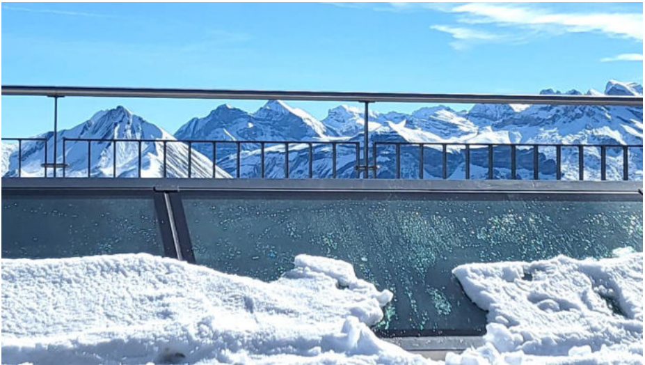
Die Aussicht auf das Bergpanorama war sensationell

Blau- und Grüntönen schimmerte und man konnte die umliegenden Dörfer und Städte wie Luzern, Weggis, Gersau etc. gut erkennen.