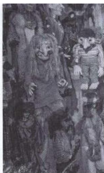
La Dream Factory che ha ospitato la cena di gala è una... collezione di collezioni di ogni genere, eterogenee e insolite. Tra le tante, un'ampia selezione di marionette.

zione ci ha risparmiato per il momento l'esperienza di una Topolino stracciatella magari accoppiata a una variegata all'amarena, ma in un contesto che chiaramente non considera elemento di valore la conformità alle livree d'origine ci si può aspettare di tutto. Ciò che in effetti, inaspetta-