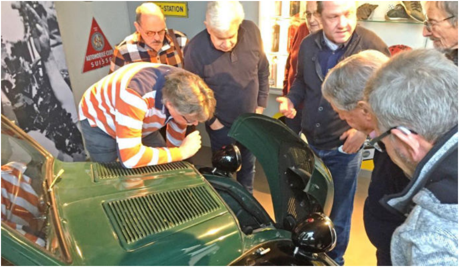
Gähnende Leere unter der Motorhaube

Ende der dreissiger Jahre des letzten Jahrhunderts wurde das Auto von einem Benziner zu einem Elektroauto umgebaut. Wohl nicht unbedingt im Gedanken gut der heutigen Zeit, sondern eher als Reklame für die Firma IMAG und als Gedankenanstoss, was mit Batterien auch noch möglich ist.