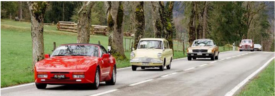
Mitglieder des ACS auf der letztjährigen Swiss Historic Vehicle-Fahrt