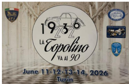
Der offizielle Flyer für das Jubiläum 2026

Die Teilnehmer wurden dann von Sibilla Antonialli verabschiedet und eingestimmt auf das Treffen 2026 in Turin.