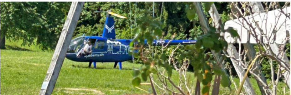
Die «Mehrbesseren» kamen mit dem Heli zum Mittagessen