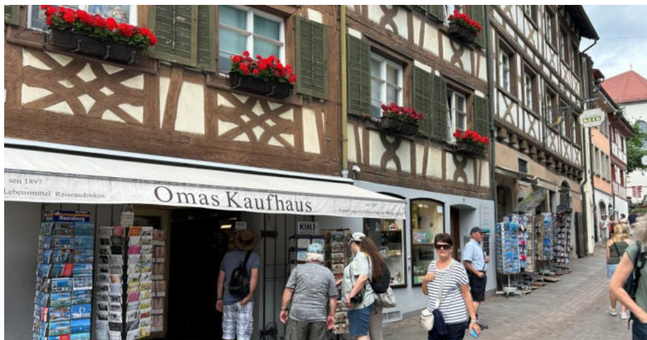
Eine der imposanten Gassen mit schönen Riegelhäusern in Meersburg

All dies liess uns die Laune aber nicht verderben. Wir setzten uns in eine schöne Gartenterrasse direkt am See und genossen ein feines Mittagessen. Anschliessend war geplant, mit dem ÖV wieder zurück nach Überlingen zu fahren. Pünktlich war der Bus da, die hintere Türe liess sich aber nicht schliessen und so hiess es, auf den späteren Bus umzusteigen. Das Gedränge in diesem Bus war dementsprechend gross. Mit etwas Verspätung trafen wir alle – unsere Gruppe ist inzwischen sehr geschrumpft – im Hotel ein.