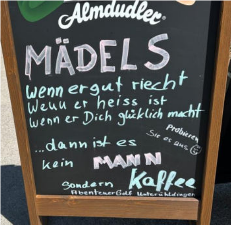
Tafel unterwegs vor einem Beizli entdeckt

Anschliessend konnte man sich – auch wieder in einzelnen Gruppen oder auch jeder für sich – den Berberaffen widmen, welche wie wir, in einzelnen Gruppen oder auch jeder für sich, die Menschen, welche die Affen anschauen wollten oder auch umkehrt... Ihr wisst schon, was ich meine, oder?