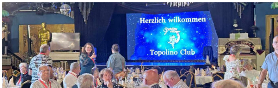
Von der Dreamfactory wurden wir im Saal willkommen geheissen