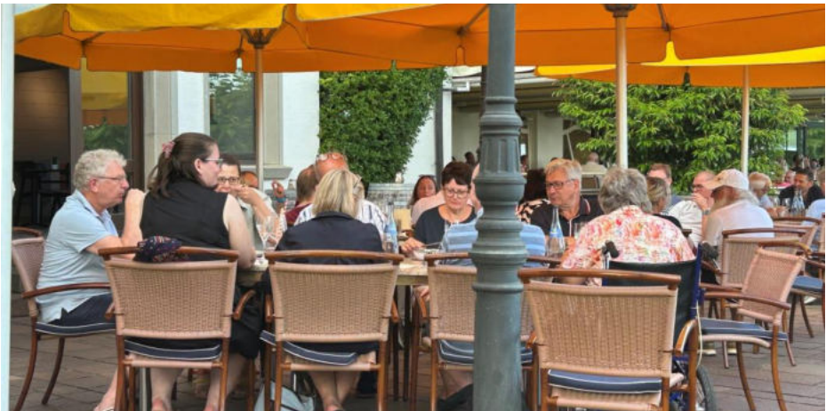
Gemütliches Beisammensein beim Apéro auf der Hotelterrasse

Das Wetter schien nach dem Gewitter etwas umzuschlagen und wir verzogen uns mit dem Bus ins Hotel. Nach einer kurzen Ruhepause, in der sich das Wetter nachhaltig gebessert hatte, fuhren wir wieder mit dem Bus ins Stadtzentrum. In einer schönen Gartenwirtschaft am See genehmigten wir uns unter einem dichten Blätterwerk und sehr angenehmen Temperaturen ein Glacé. Bevor wir mit dem Bus ins Hotel zurück fuhren, vergewisserten wir uns, ob die im Prospekt angegebenen Abfahrtszeiten der Schiffe stimmen. Wir wollten ja in dieser Ferienwoche noch eine Schifffahrt auf dem Bodensee machen.