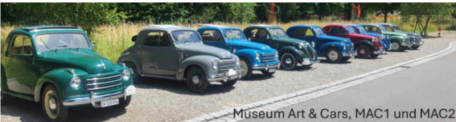
Museum Art & Cars, MAC1 und MAC2