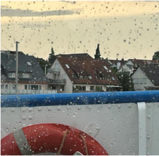
Im innen des Schiffes fanden wir Schutz vor dem Regen

Nun folgten die Stationen vom Vormittag in umgekehrter Reihenfolge. Leider begann es nach der Mainau zu regnen. Plötzlich hatten wir das Gefühl, dass es wegen des Fahrtwinds nicht senkrecht, sondern waagrecht regnete. Darum flüchteten wir ins Innere des Schiffes.