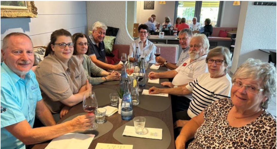
Beim gemeinsamen Nachtessen liessen wir den Tag gemütlich ausklingen

Am späteren Nachmittag kamen wir erholt und wohlbehalten in Überlingen an und genossen in einem Restaurant am See noch ein feines Dessert, bevor wir mit dem Bus zurück ins Hotel fuhren.