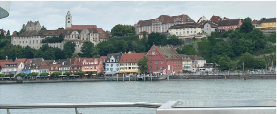
Meersburg während der Schifffahrt am Vortag fotografiert

Hoch über dem Bodensee thront das Wahrzeichen dieser Stadt. Hinter den Mauern dieser prächtigen und dominanten Burg steht eine 1000 Jahre alte Geschichte. In den Gemäuern sollen Könige, Kaiser und Bischöfe gewirkt und diese belagert haben. Sie wurde jedoch nie zerstört und prägt das Bild von Meersburg heute noch eindrücklich.