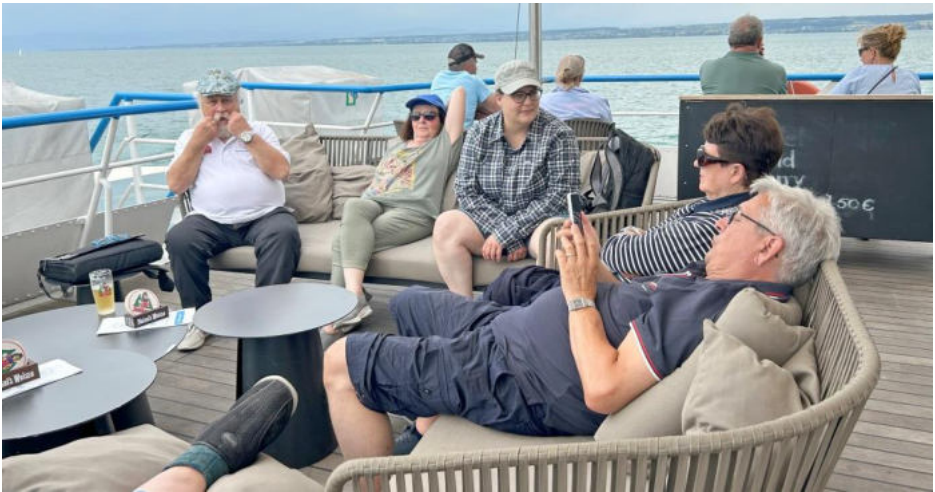
Da war es noch trocken und gemütlich auf dem Schiffsdeck

Nächste und letzte Station war der Hafen von Konstanz. Im Hafeneareal herrschte ein grosses Kommen und Gehen von unzähligen Touristen. Inzwischen war es Mittag geworden, und wir suchten uns ein Restaurant fürs Mittagessen. Dabei halbierte sich unser Grüppchen. Vier wollten im Konzil essen und wir vier, Rubis und Häuslers, fanden auf der Terrasse eines ursprünglichen Güterschuppens einen gemütlichen Tisch. Nach dem Essen trafen wir uns wieder am Hafen zur Rückfahrt nach Überlingen und auf dem Schiff liesen wir uns auf dem Oberdeck in einer Polstergruppe nieder.