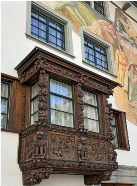
Einer der vielen reich verzierten Erker