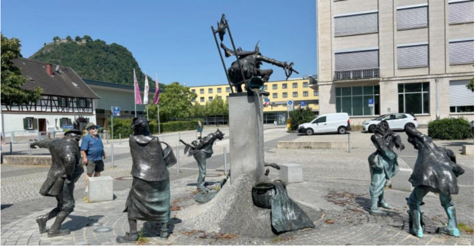
Der «Narrenbrunnen» in Singen