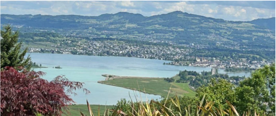
Das Restaurant ist wunderbar hoch über dem Zürichsee gelegen

Die Aussicht von der Terrasse des Restaurants war fantastisch. Man wähnte sich wie auf einem riesigen Balkon über dem Zürichsee, mit Blick auf die Inseln Ufenau und Lützelau, über Rapperswil, das Zürioberland bis zum Bachtel und in die Voralpen. Dabei konnten wir beobachten, wie einige Gäste nicht mit dem Auto, sondern gleich mit dem Privathelikopter anfliegen, denn dieses Restaurant verfügt neben dem Auto-Parkplatz auch über einen Heli-Landeplatz.