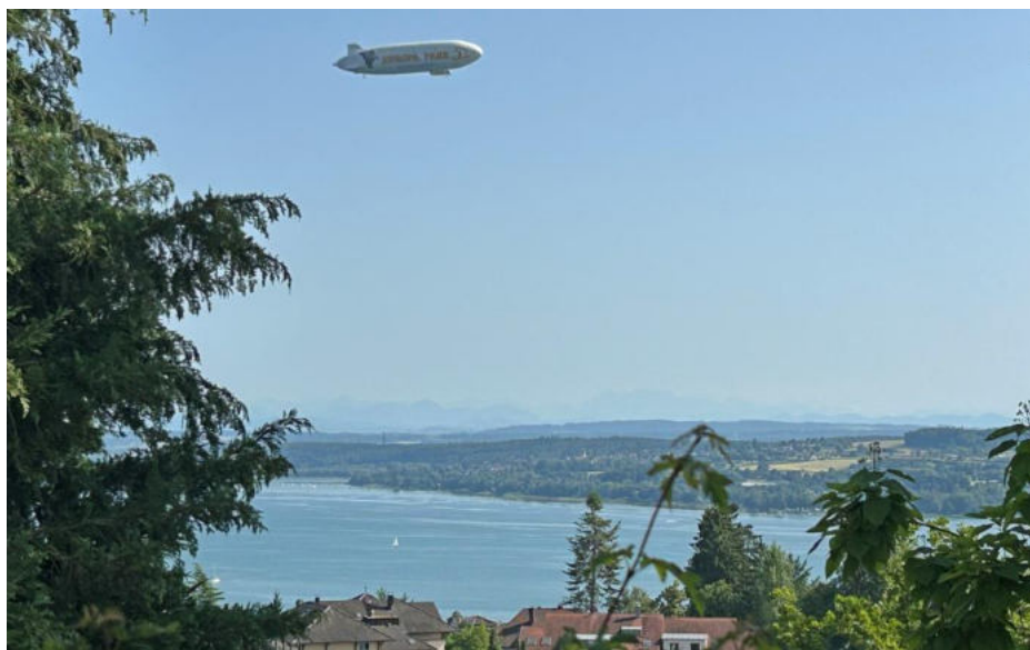
Auch der Zeppelin zog ab und zu seine Runden über dem Bodensee