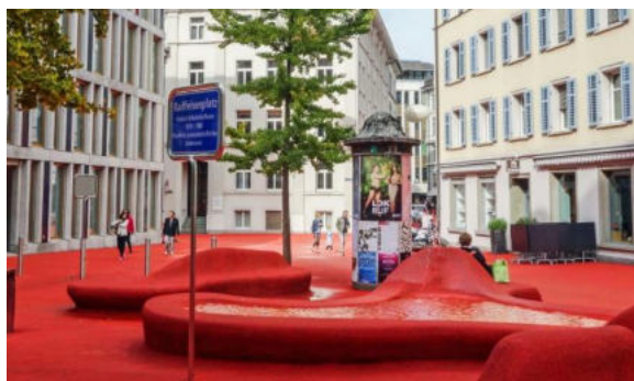
Der Bekannte «Rote Platz» in St. Gallen, der mit seinen Betonmöbeln zum Verweilen einlädt

Besagter Bus brachte uns direkt zum von Pipilotti Rist entworfenem Stadttreffpunkt, der City Lounge – «Red Square» oder auch «Roter Platz» genannt. Teilweise heisst er auch Raiffeisenplatz, und vormals, bei vielen St. Gallern auch noch heute, Bleicheliplatz; für einen Auswärtigen wie mich gar viele Bezeichnungen.