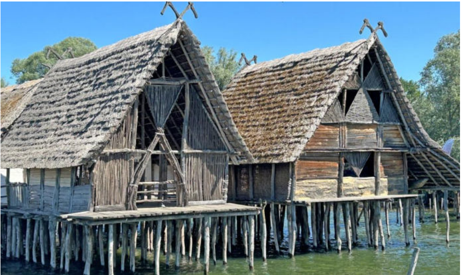
So hauste man vor Jahrtausenden am Bodensee

Bei einmal mehr optimalen Witterungsbedingungen fahren wir in zwei Gruppen (Gruppe Parkhotel St. Leonhard) und (Gruppe Strandhotel Seehof) die eher kurze aber nicht minder reizvolle Strecke mit unseren Topolinos in die Pfahlbauten-Siedlung nach Unteruhldingen – direkt am Bodensee gelegen und notabene das älteste archäologische Freilichtmuseum Deutschlands! Nach dem ausgiebigen «Herumschlagen» mit dem Parkplatz-Regime konnten wir den kurzen Marsch zu den Pfahlbauten unter die Füße nehmen. Wir unterteilen uns in verschiedene Gruppen, die einen auf eigene Faust erkundend – die anderen im Rahmen kurzweiliger und interessanter Führungen.