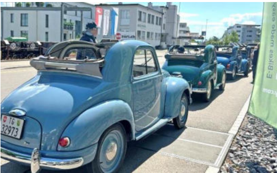
Aufkolonieren auf der Seestrasse

Heute weckte uns alle die Morgensonne und kündigte einen wunderschönen Tag mit blauem Himmel an. Auf dem Programm stand für die 12 angemeldeten Topolinos die Fahrt ins Blaue. Treffpunkt war dieses Mal das Hotel Schwan in Horgen und wir durften auf dem Dorfplatz vor dem Hotel den vom Club spendierten Kaffee mit Gipfeli geniessen. Die schöne Ambiance wurde durch viele Trachtenfrauen bereichert sowie von Alphornklängen untermalt.