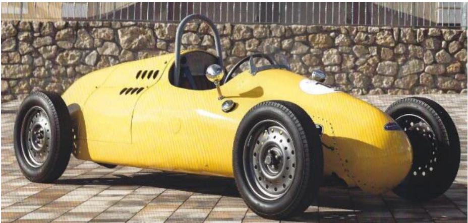
Fiat Spezial, Topolino Formel 3 im Kaáli Museum