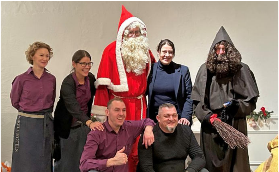
Samichlaus und Schmutzli mit der Crew des Sonnentals