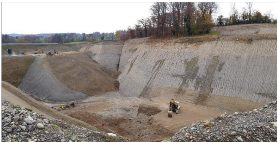
Ansicht Seitenmoränen im Querschnitt an der Strasse von Freudwil nach Uster

Dann, vor 15 000 Jahren – auch schon lange her – zogen sich die Gletscher ganz zurück und hinterliessen die Landschaft der modernen Menschengattung, die Neandertaler hatten sich bereits aus dem Staub gemacht, die anfangs noch Pfähle in den Seeboden schlugen, Hütten darauf stellten, Pfahlbauer eben, später dann Wälder rodeten und sesshaft wurden. Erdgeschichtlich gesehen leben wir vielleicht wieder in einer Zwischeneiszeit, Klimawandel hin oder her, die Natur wird's schon richten, mit oder ohne den Homo Sapiens.