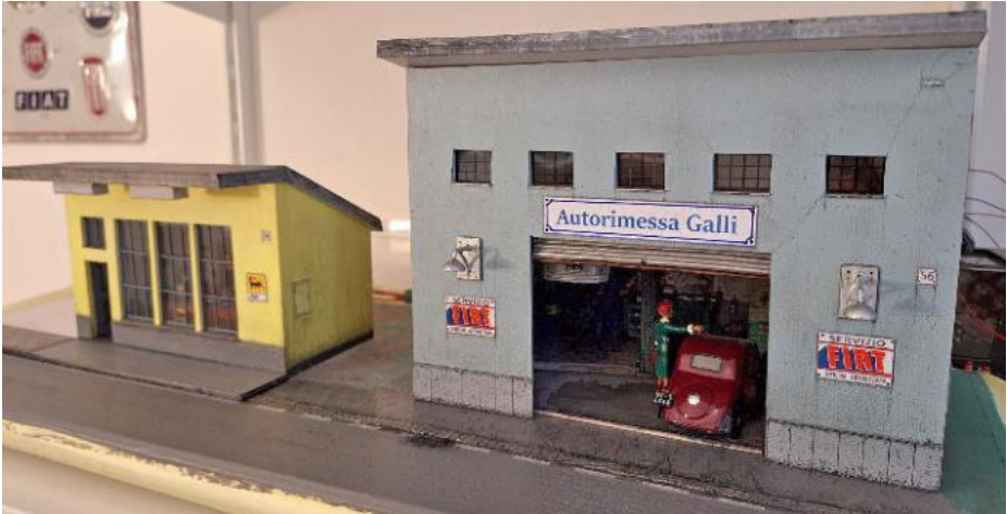
Ein Teil der Idee ist realisiert

Bis heute habe ich die Tankstelle und die Garage gebaut. Nun folgen das Wohnhaus mit Bar und dann noch die Umgebung mit Schrottplatz.