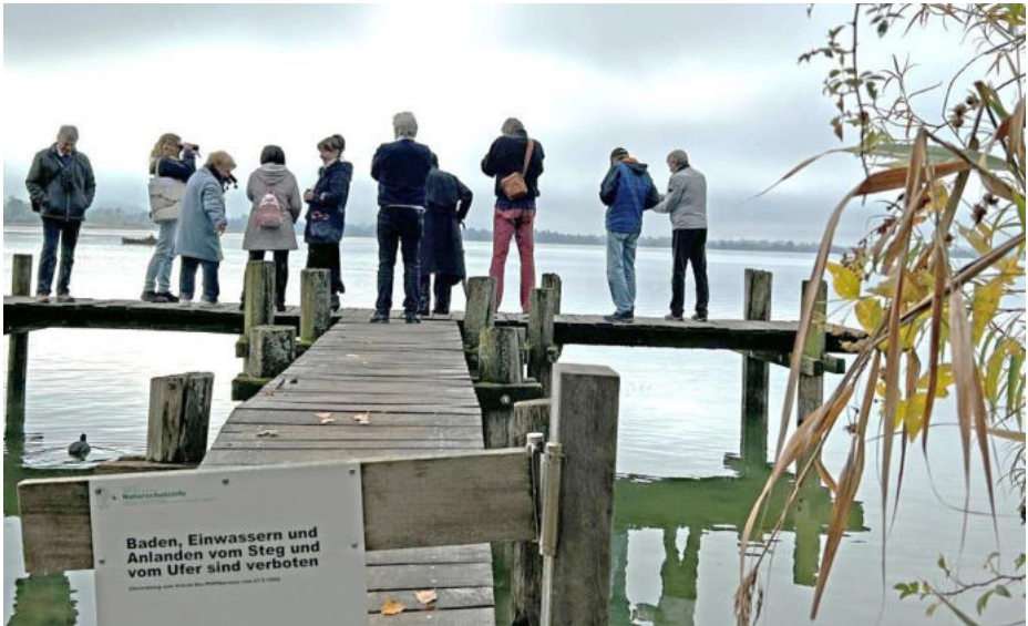
Neblige Aussicht vom Steg aus

Sehr interessant waren dann die Erklärungen zu den hier vorkommenden Süßwasserkrebsen, insbesondere deren Ritualen und Gewohnheiten zwecks Fortpflanzung, die manch eine und einer zum Schmunzeln brachte. Leider sind diese Tierchen nachtaktiv und folglich um 12 Uhr mittags unter Steinen versteckt im Tiefschlaf.