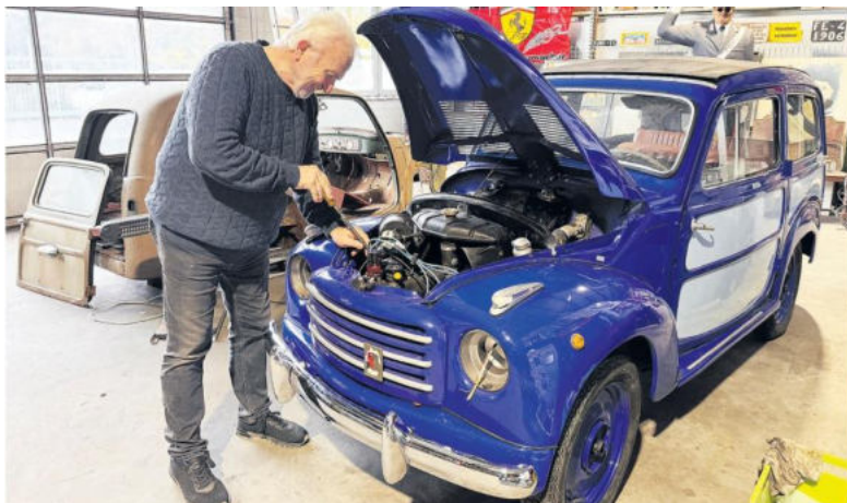
Der blaue Topolino wird derzeit restauriert und ist schon bald fahrbereit.