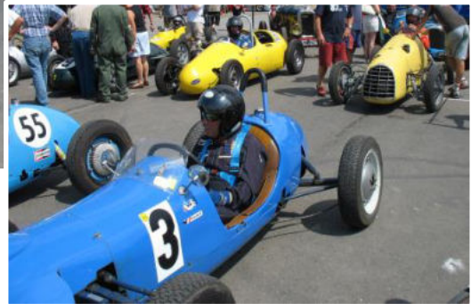
Formel 3 Racer am Schottenring