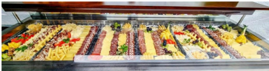
Das feine Käsebuffet – ausgerichtet vom Hotel Engel – wurde rege genutzt