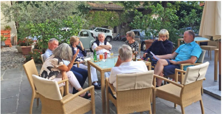
Beim Apéro im Innenhof des Hotels Orazio – es war bei weitem nicht der einzige!

Und nicht weniger erwähnenswert ist, dass die rund 1000 gefahrenen Kilometer wiederum pannenfrei zurückgelegt werden konnten, was wirklich keine Selbstverständlichkeit bei unseren Oldtimern ist. Kurzum es waren wunderschöne Tage, die wir gemeinsam verbracht haben!