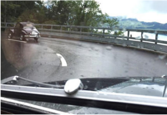
Auf der Talfahrt nach Beckenried fielen die letzten Regentropfen