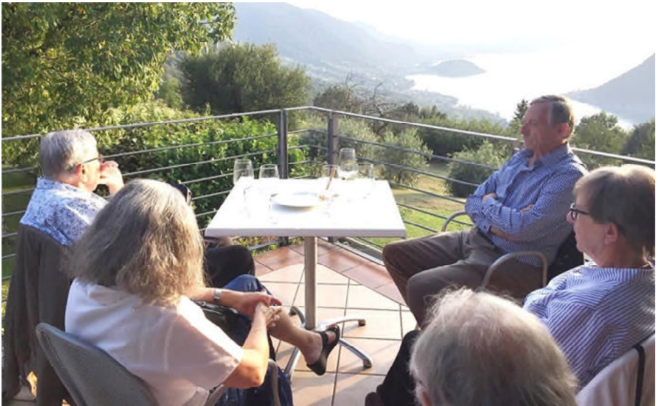
Beim Apéro bot sich eine tolle Sicht auf den Iseosee

Zum Nachtessen holte uns der Kleinbus vor dem Hotel wieder ab. Die Fahrt ging in die Höhe zur Trattoria Partole, von wo aus wir eine tolle Aussicht mit traumhaftem Sonnenuntergang hatten.