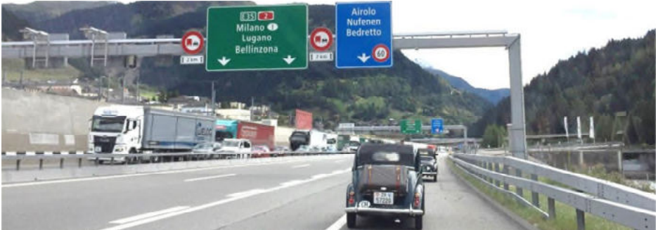
Möglichst schnell verliessen wir die Autobahn wieder – vorübergehend auf dem Pannestreifen, bis alle aufgeschlossen waren

wir auf der alten Strasse, um möglichst den schnellen Verkehr auf der Autobahn nicht zu behindern. Im Tunnel, der bis etwa zur Hälfte immer leicht ansteigt, waren wir dann halt schon ein Hindernis für den Verkehr hinter uns. Aber nach dem Tunnel nahmen wir die erste Ausfahrt und fuhren auf der Landstrasse Richtung Airole, wo wir einen kurzen Kahifhalt einschalteten.