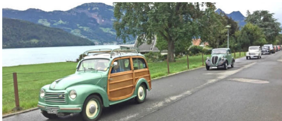
Durchfahrt der Topiparade in «Neuseeland» am Vierwaldstättersee

Alsdann tuckerten wir dem schönen «Lake Lucerne» entlang bis Buochs/Nidwalden/Schweiz! Uff, «Neuseeland» stand gross und überzeugend an einer Hauswand. So schnell waren wir jedoch nicht, als Ziel vielleicht ein andermal!