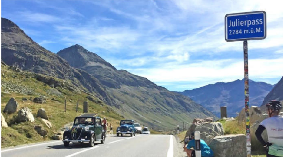
Ankunft auf der Passhöhe

Für die Fahrt zur Julier-Passhöhe mussten die Motörli alles geben, auch wenn nur ca. 470 Höhenmeter zu bezwingen waren. Die Strasse war teilweise recht steil und verlangte ab und zu das «Abeschalte in erschte Gang». Schliesslich sind aber alle gut am höchsten Punkt auf 2284 m ü.M. angekommen.