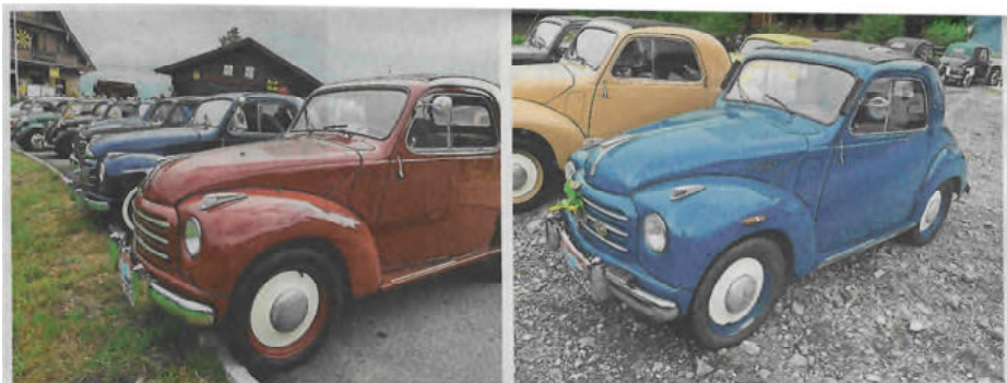
Topolino-Fahrer aus ganz Europa trafen sich am Wochenende in Seelisberg für einen gemeinsamen Urnerseeausflug. Zwischen 1936 und 1955 wurden in Italien über eine halbe Million Topolinos produziert.

Seelisberg/Emmetten | Internationales Fiat-Topolino-Treffen