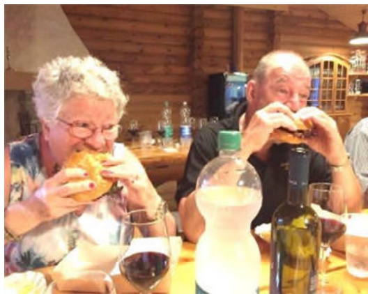
Hamburger essen ist Glückssache

Ab 18.30 gab es im Blockhaus des Centers das Abendessen. Die Hamburger wurden im Food Track gebraten und angeordnet und von uns abgeholt. Die Stimmung war locker.