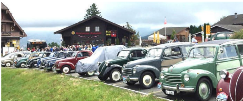
Auf dem Parkplatz der Bergstation der Treib-Seelisberg-Bahn

So wurde uns auch erzählt, dass früher die Bahn offenbar mit Stühlen bestückt war. Dafür habe es nun aber zu wenige in Seelisberg, darum sind es heute Bänke. Mit der Bahn brachten wir dann den Weg nach Treib auf dem bis zu 83% steilen Weg hinter uns.