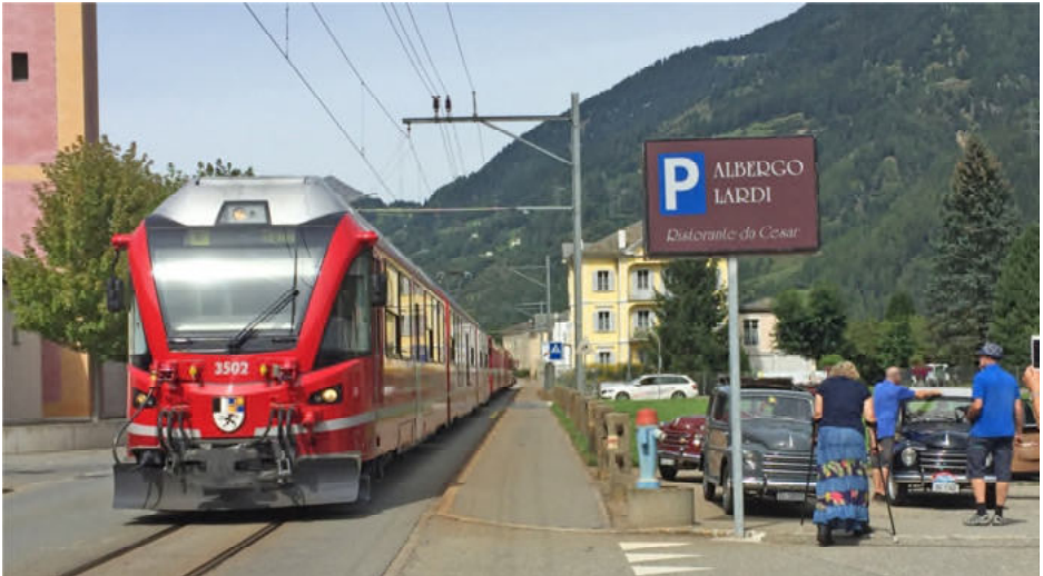
Nach der Mittagsrast in Poschiavo