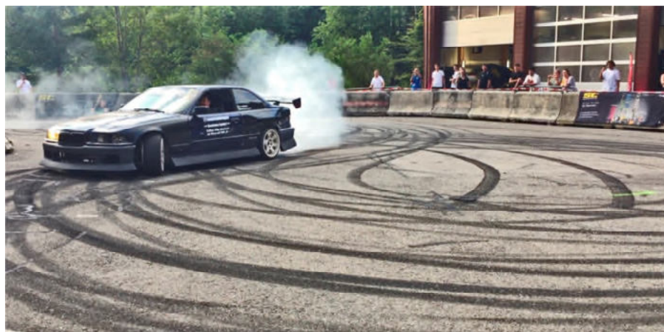
Ein eher spezielles Vergnügen: Schleudernd Runden zu drehen und Spuren auf dem Asphalt hinterlassen (und definitiv nichts für Topis!)

konnten. Ein lautes und eindruckliches Spektakel! Es reisten sehr viele Autos aus der ganzen Schweiz zu diesem Anlass an.