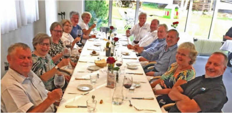
Beim letzten gemeinsamen Nachtessen in Pontresina