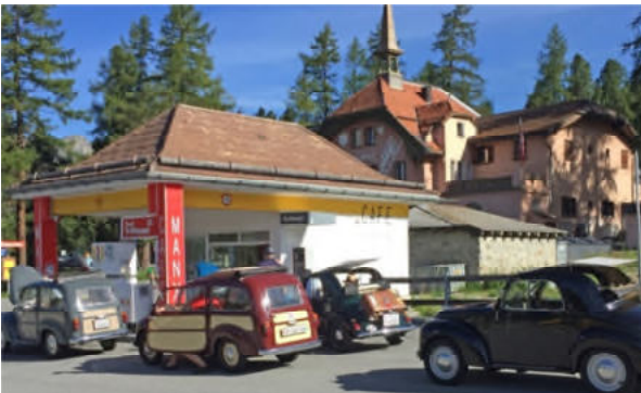
Tanken – bei der Talstation der Muottas-Muragl-Bahn

zur Fahrt über den Julier nach Tiefencastel, Thuis Richtung Norden. Es war noch recht kühl in Pontresina obwohl die Sonne schien, trotzdem wurde «offen gefahren», denn es sollte ja wieder ein heisser Tag werden.