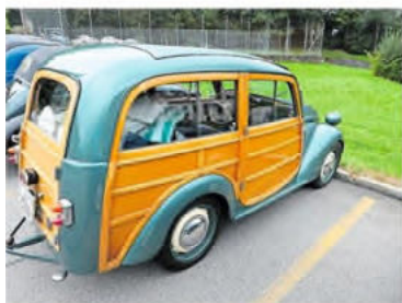
Am Treffen in der Zentralschweiz waren die unterschiedlichsten Modelle des Fiat 500 zu sehen. Die Besitzerinnen und Besitzer hegen und pflegen ihre Fahrzeuge voller Freude und Stolz.