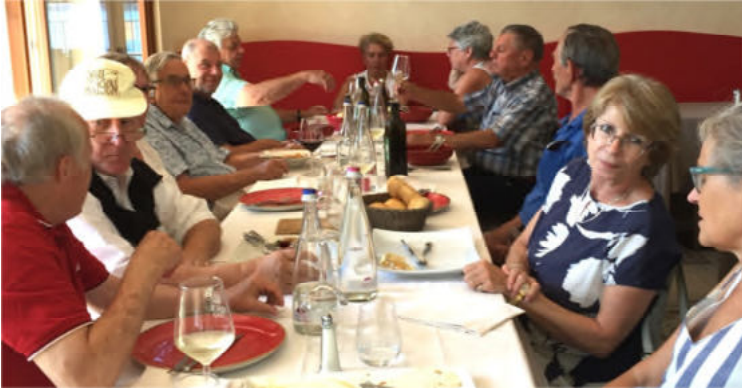
Gemütliche Stimmung beim Mittag- essen

Anschliessend blieb noch genügend Zeit, auf der Insel zu verweilen, sei es für ein Bier, un buon gelato oder Einkäufe.