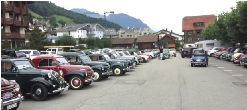
Am Internationalen Topolino-Treffen in Emmetten vom 25.-27. August 2023

Interessierte sollen sich bitte das Datum schon mal reservieren – am besten jeweils eine Woche davor und eine Woche im Nachgang, um so die nötige planerische Flexibilität zu haben. Alles Weitere folgt zeitnah.