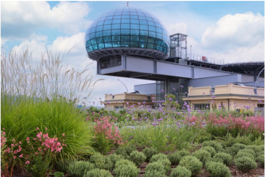
Das Lingotto-Dach wurde begrünt, es entstand die «Pista Cinquecento» mit Pflanzen und Bäumen

In einer Pressemitteilung von FIAT ist zu lesen: «Es ist heute ein Ort, der vor hundert Jahren per Definition ein Ort der Umweltverschmutzung war, mit einer Teststrecke, die früher geheim und unzugänglich war. Heute ist es ein Garten, der sich allen Turinern und Besuchern öffnet. Dies unterstreicht, dass unser Ziel nicht nur darin besteht, Autos zu vermarkten, sondern dass es bei unserer neuen Reise auch darum geht, das Klima, die Gemeinschaft und die Kultur zu schützen».