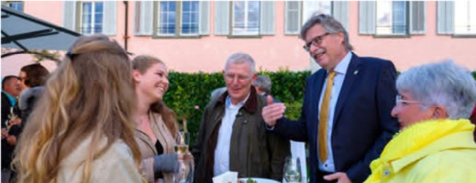
Gemütliche Stimmung beim Apéro am Zürichsee