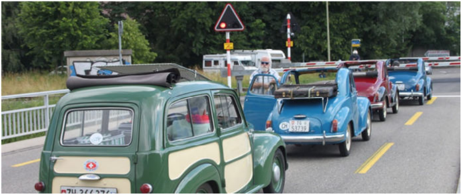
Zwangshalt vor geschlossener Barriere unterwegs

Bei einmal mehr optimalen Witterungsbedingungen traf die Mehrheit der Teilnehmenden am diesjährigen Picknickanlass im Parkhotel Wallberg zu Volketswil gegen 08.30 Uhr ein. Die heute aktuellen Pächter des Wallberg konnten sich (nach einem Blick in die Unterlagen) sogar daran erinnern, dass der TCZ das Restaurant Wallberg auch schon mal als Stammlokal hatte. Nach einem ca. \frac{3}{4} -stündigen Kaffee-/Gipfeliaufenthalt im Wallberg (Danke an den Topolino Club Zürich für das Sponsoring) ging's auf die Fahrt von Volketswil durch das Züri-Oberland. Knapp zehn Topis und weitere vier Wegwerfautomobile machten sich mit ca. 27 Menschen und der obligaten Hündin Bonnie auf die Fahrt eben durch das Zürcher Oberland.