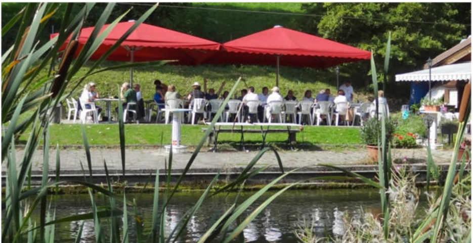
Beim Mittagessen im Forellenhof

Im Restaurant Forellenhof erwartete uns auf der Terrasse ein feines Mittagessen. Wir speisten gleich neben dem Forellenteich und konnten uns davon überzeugen, dass der Fisch wirklich ganz frisch auf die Teller kam. Kurz nach einer Bestellung erschien der Koch mit einem Fangnetz und holte die Mahlzeit frisch aus dem Teich. Wenig später wurde der Fisch dann knusprig gebraten serviert.