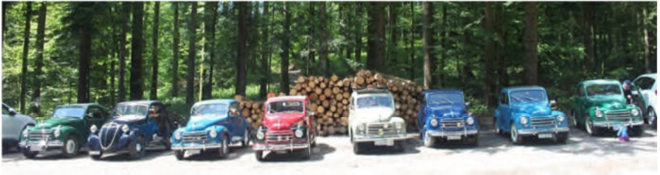
Imposanter Anblick auf dem Parkplatz bei der Waldhütte