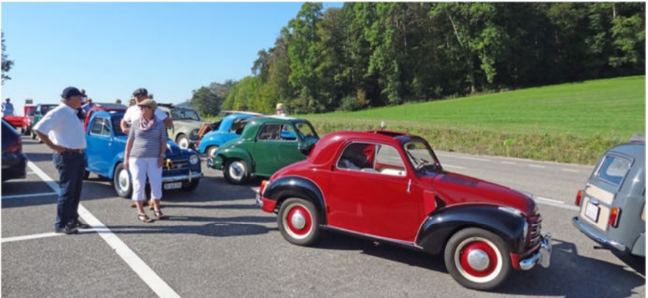
Kurzer Zwischenhalt auf einem Parkplatz, bis wieder alle „aufgeschlossen“ haben

Das „Baselland“ ist eine hügelige Landschaft, und zum Teil geht es sogar recht steil bergauf und -ab. Das mussten wir auf der Fahrt, natürlich möglichst auf Nebenstrassen, von Liestal über Hersberg, Rickenbach, Buus, Frick, Herznach bis zur Staffelegg erfahren (im wahrsten Sinne des Wortes).