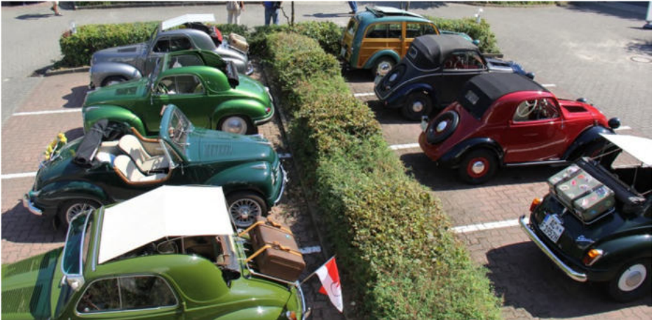
Eintreffen zum Internationalen Topolino Treffen in Deutschland

Am Donnerstag 22. August starteten Anita und ich die Anreise also mit dem normalen PW auf überwiegend Deutschen Autobahnen. Die 650 km überwinden wir via Stuttgart – Würzburg – Fulda – Kassel wo wir dann kurz vor Hildesheim abbogen und um ca. 16:00 Uhr in Bad Salzdetfurth im Hotel eintrafen.