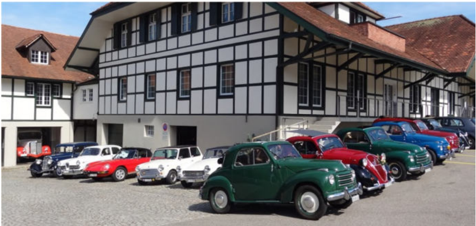
Topis neben anderen Oldtimern vor der Halle, in der das Museum „versteckt“ ist