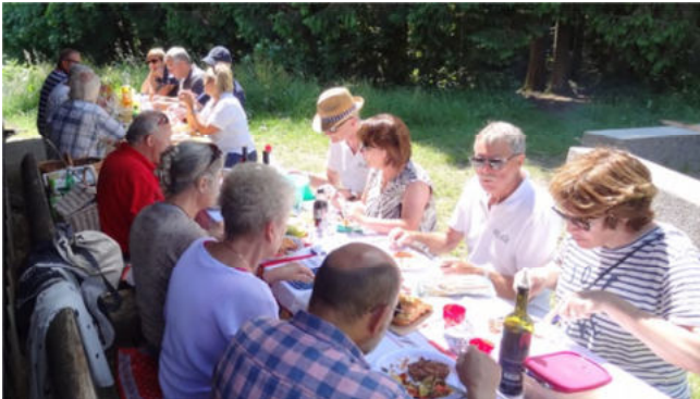
Die Topianer beim Geniessen ihrer zubereiteten Grilladen