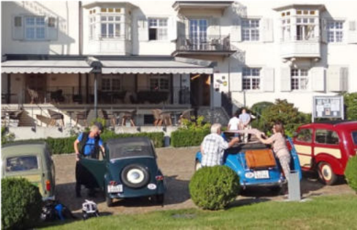
Das „Sunnesägel“ wird gesetzt...