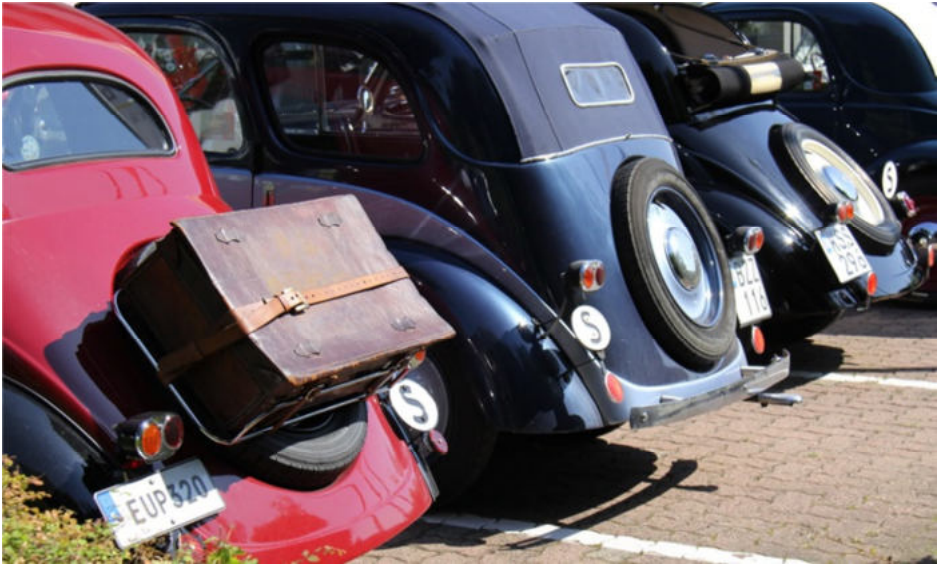
Auf Achse angereiste Topis aus Schweden