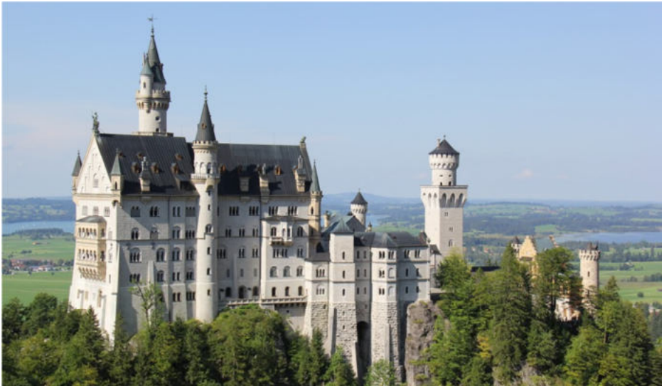
Schloss Neuschwanstein fotografiert von der Hängebrücke aus