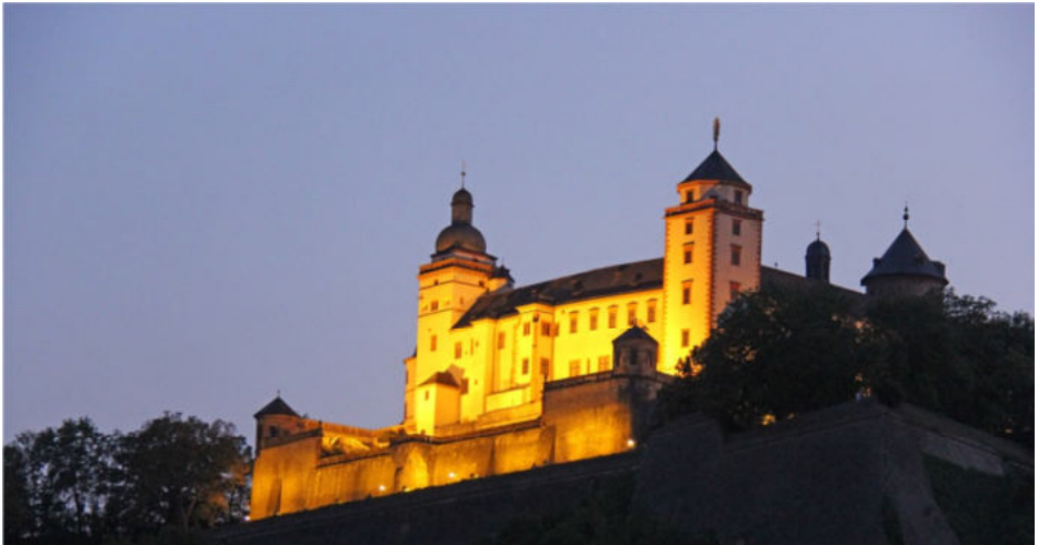
Festung Marienberg in Würzburg in Abendstimmung