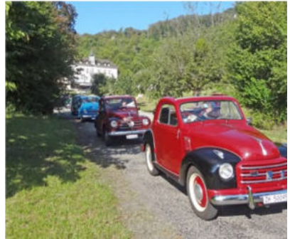
... und los geht die Fahrt

Das „Baselland“ ist eine hügelige Landschaft, und zum Teil geht es sogar recht steil bergauf und -ab. Das mussten wir auf der Fahrt, natürlich möglichst auf Nebenstrassen, von Liestal über Hersberg, Rickenbach, Buus, Frick, Herznach bis zur Staffelegg erfahren (im wahrsten Sinne des Wortes).