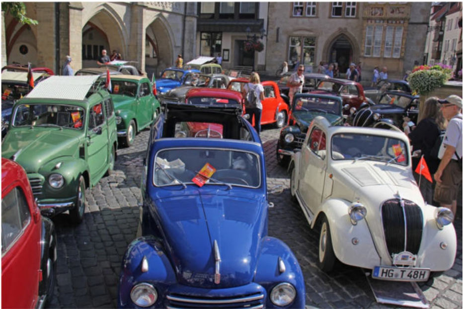
Topis auf dem Rathausplatz in Hildesheim