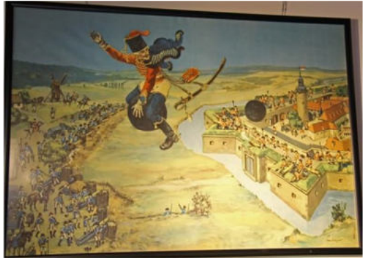
Baron von Münchhausen als Erfinder der bemannten Drohne