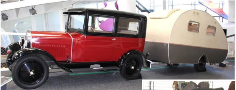
Eine eher spezielle Komposition

muss sich vorstellen, dass wir durch die sehr gute Führung richtig hineinleben konnten. Vom ältesten bis zum jüngsten Wohnmobil. Wow, welche Entwicklung! Das Museum hat mich total fasziniert, sodass ich es gerne weiter empfehle.