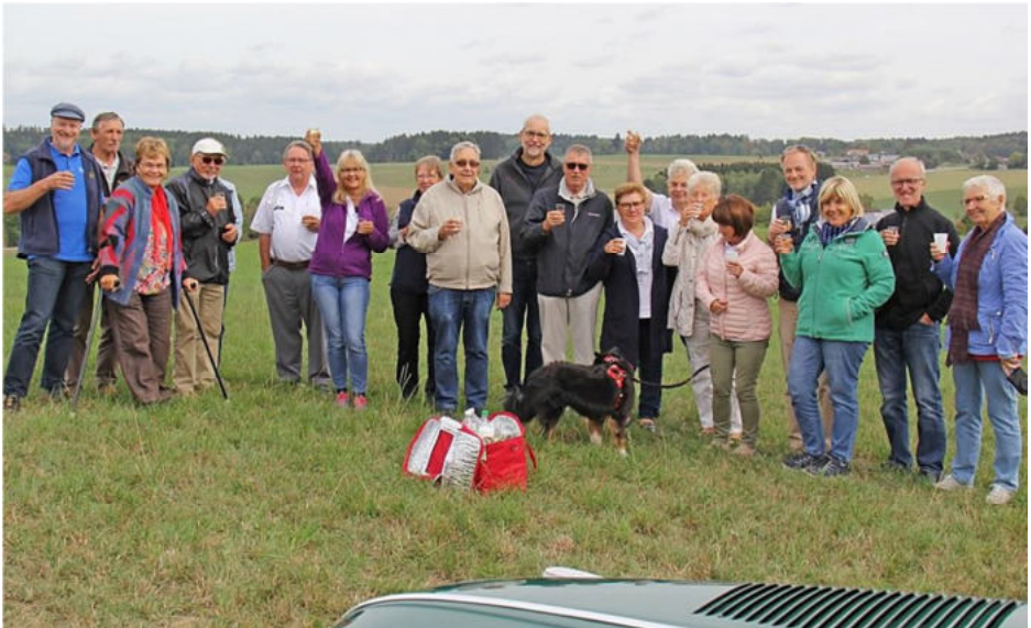
Fröhliche Stimmung herrschte beim Apéro