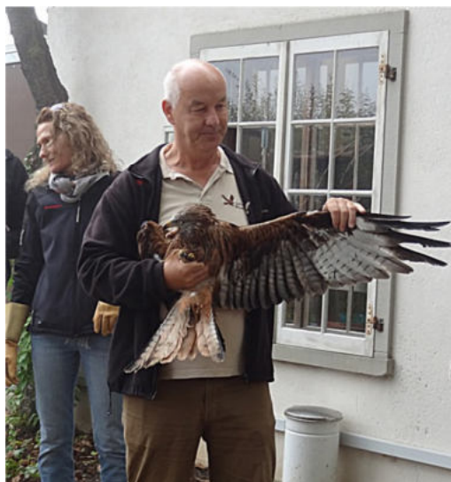
Dieser genesene Greifvogel wurde von seiner Patin (links im Bild) ein paar Minuten später freigelassen