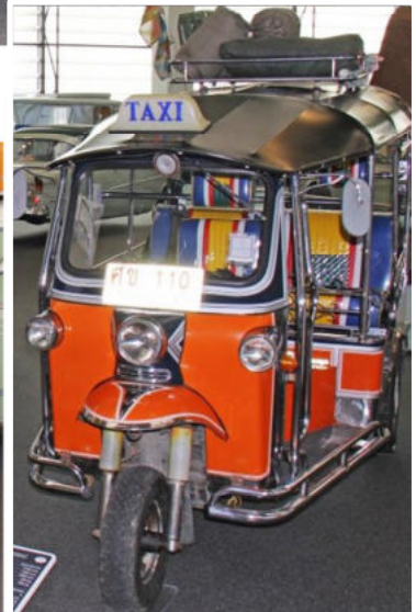
Sogar das kleinste Vehikel kann zu einem Camper umgebaut werden

Am späteren Nachmittag hiess es wieder weiterfahren und zwar nach Altann, (immer noch im schönen Ausland), wo wir im Landhotel Allgäuer Hof das Abendessen serviert bekamen und übernachten konnten. Mit eindrücklichen Erlebnissen liessen wir den schönen Tag ausklingen.