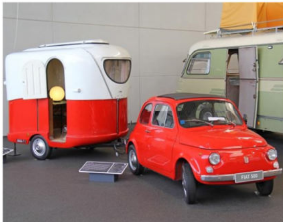
Keiner zu klein, ein Zugfahrzeug zu sein