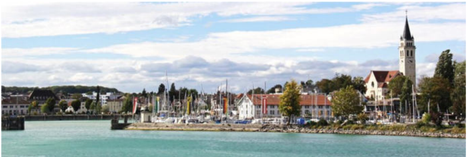
Die Skyline von Romanshorn aus der „Fährenperspektive“