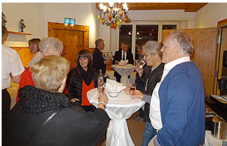
Angeregte Gespräche während dem Apéro vor der GV