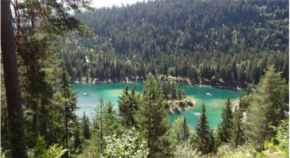
Blick auf den Caumasee in Flims

Nach stärkender Mittagspause heisst das nächste Ziel hinauf zum Parkplatz, ich nehme an, dass die meisten eine gratis Beförderung bevorzugten.