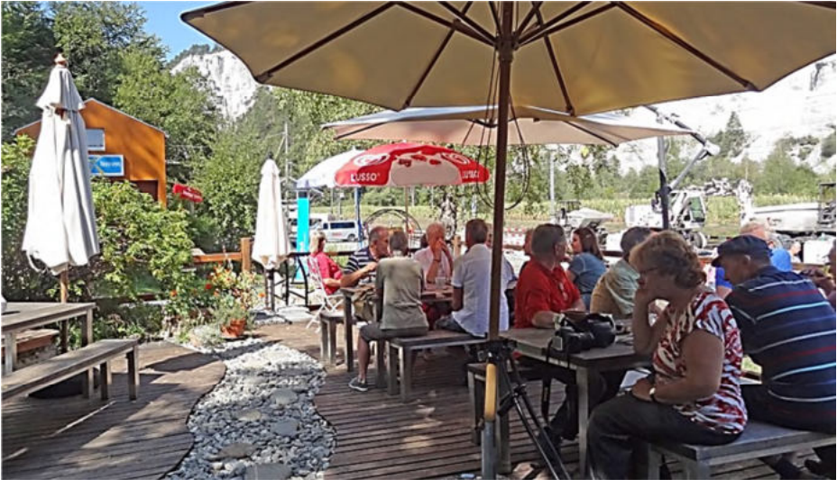
Kafihalt im kleinen Bistro neben dem Bahnhof Versam

Weiter ging's durchs Safiental nach Versam, dort bogen wir rechts in die Sackstrasse, welche immer steiler und schmaler wurde und beim Bahnhof Versam ein jähes Ende nahm. Extra für uns öffnete das kleine Bistro-Lädli „Einkehr & Mystik“ mit gemütlichem Gartensitzplatz. Bei Kaffee und Bündner Nusstorte stärkten wir uns für den steilen Aufstieg, welcher mit Anlauf und zeitlichen Abständen erfolgreich gemeistert wurde.