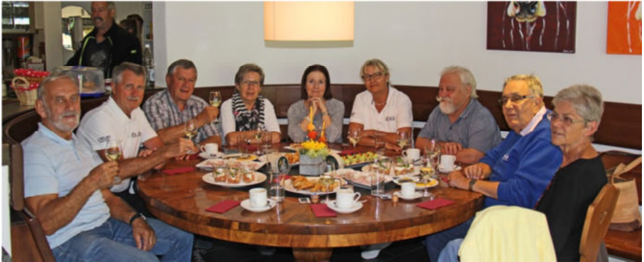
Am Stammtisch in Filzbach