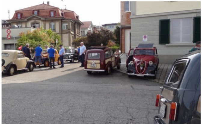
Die Topis sind für die Fahrt nach Gwatt startbereit

Nach einem geschwätzigen Zmorge wurden die sieben Topis per Autolift aus der Tiefgarage im UG des Hotels Berchtold ans Tageslicht gehievt. Auf dem noch regenfeuchten benachbarten Parkplatz, während den üblichen technischen Kontrollen, gesellte sich ein Burgdorfer Oldiefreak zu uns. Er staunte über unsere kleinen Motörchen ohne Wasser- und Benzinpumpe. Begreiflich, da er einen Studebaker, Triumph und einen Renault Alpine besitzt, die ja viel besser bestückt sind.