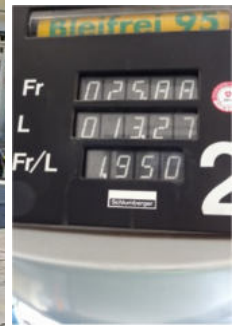
Bim tanke a de tüürschte Zapfsühle wiit und breit