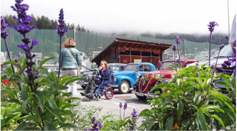
Auf dem zügigen Parkplatz in Lenzerheide

Glanzleistung!! Alle erreichten ohne Probleme Lenzerheide. Bei der Kirche gab's für die Autos eine verdiente Pause.