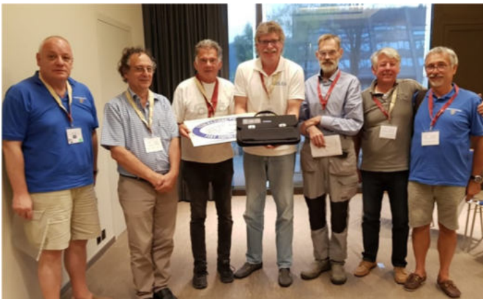
Die Präsidenten bzw. Vertreter der Mitglieder-clubs der Federazione trafen sich in Gwatt zur jährlichen Zusammenkunft

Gleich nach dem Eintreffen in Gwatt trafen sich die Präsidenten der anwesenden Topolino Clubs bzw. deren Stellvertreter zum jährlichen Federazione-Meeting. Die Federazione ist die Dachorganisation von neun Topolino Clubs in Europa: je drei aus Italien und der Schweiz und je einem aus Deutschland, Holland und Belgien. Es wurde bekräftigt, dass die Federazione die Freundschaft und Verbundenheit unter den Topolino-Clubs und deren Mitglieder pflegen, ausbauen und fördern will. Dies unter anderem mit den jährlichen Internationalen Topolino-Treffen oder durch gegenseitigen Informationsaustausch.