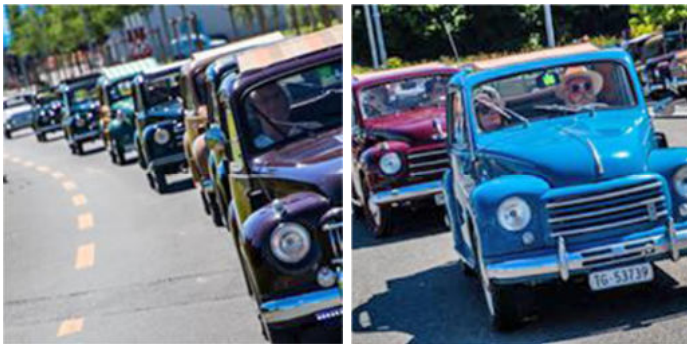
Einfahrt der Topolino-Delegation beim Ace Cafe

Nach etwa einer Stunde fuhr dann die Delegation Topi Club Zürich mit 22 Topis Richtung Rothenburg zu unserem heutigen Ziel, dem Ace Cafe Luzern. Der Name Ace Café sagte mir eigentlich nichts. Was wir zuerst sahen, war die Ausstellung vor dem Cafe: Oldtimer aller italienischen Hersteller in Reih und Glied. Ein fantastisches Bild.