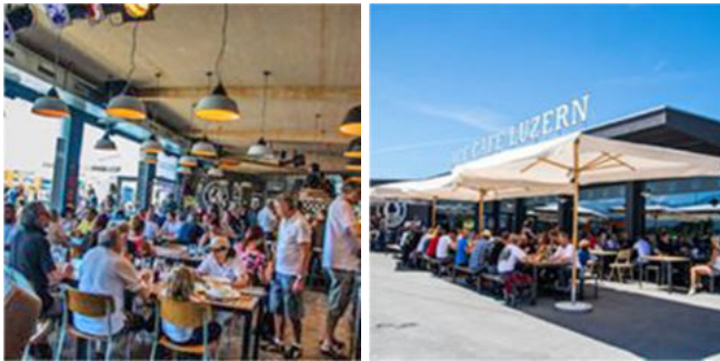
Der Andrang im Restaurant und im Freien war gross

Bei unserer Ankunft wurde uns mitgeteilt, dass etwas mit der Reservation nicht geklappt habe und nicht genug Tische zu Verfügung stehen würden. Wir Zürcher sollen warten bis die Luzerner fertig mit Essen seien und dann deren Tisch übernehmen. Wir freuten uns eigentlich auf ein Zusammensitzen mit unseren Freunden von Luzern und Bern. Auch hatten wir keine Lust, in der Hitze zu stehen. So trennten wir uns und versuchten, in kleinen Gruppen am Schatten, das heisst im Innern des Cafes Platz zu finden, was uns auch gelang. Die Speisekarte war reichlich, aber für mich etwas ungewohnt, Hamburger in verschiedenen Variationen, aber immerhin „Bio“ (was immer das heisst), Fish and Chips etc. Ich habe das erste Mal in meinem Leben Fish and Chips gegessen, geschmeckt hat es eigentlich ehrlich gesagt ganz gut.