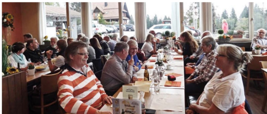
Beim Mittagessen im Gottschalkenberg