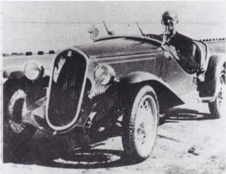
Der französisch-schweizerische Star-Architekt Le Corbusier zeigte sich bei einer Probefahrt im Balilla Spider begeistert von Auto und Bauwerk.