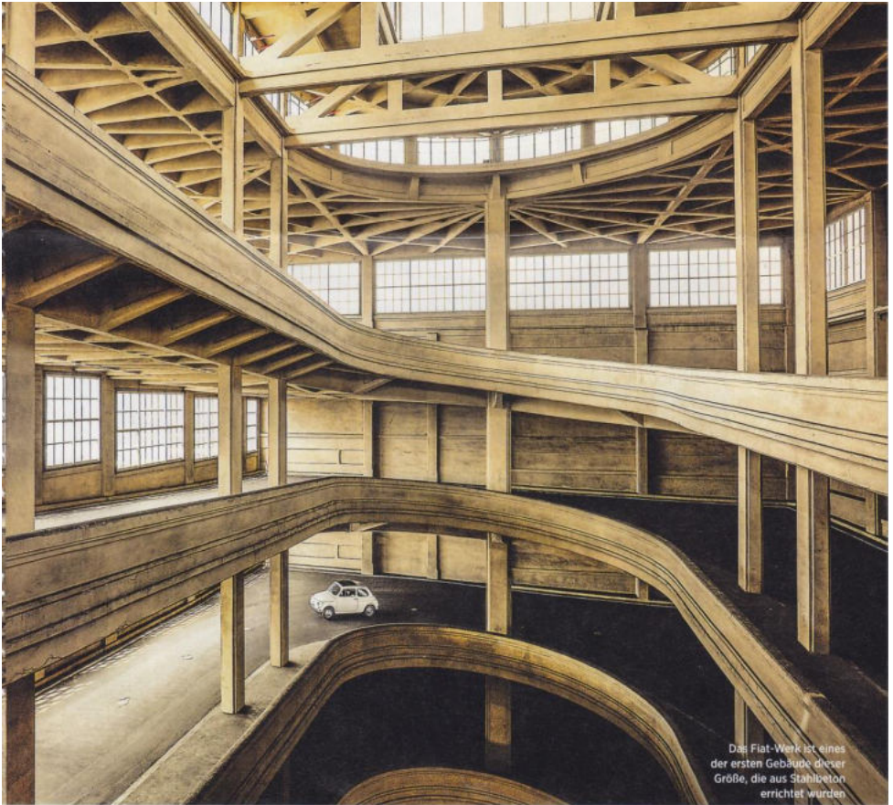
Das Fiat-Werk ist eines der ersten Gebäude dieser Größe, die aus Stahlbeton errichtet wurden