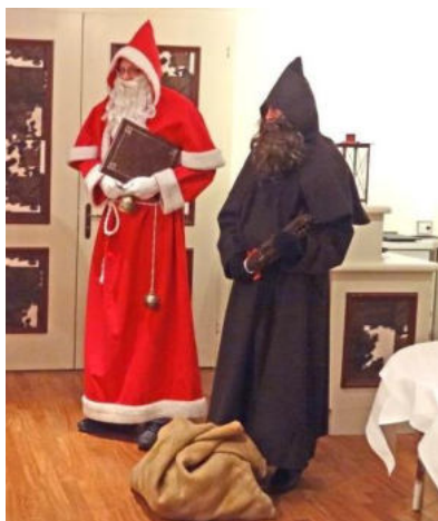
Der Schmutzli hat die Fitze bereit

Nach dem Eintreffen der beiden zierte man sich noch etwas und niemand wollte den Anfang machen und sein Sprüchli vortragen. Dann rief der Samichlaus aber einzelne auf und die meisten hatten wirklich eines auf Lager, auch wenn es vom Handy abgelesen werden musste und dabei nur zwei Zeilen aufwies. Eine kleine Auswahl der Beiträge sei hier abgedruckt.