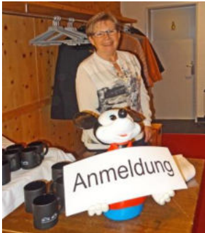
Bei der Anmeldung erhielten die Mitglieder eine Tasse mit Logo

Impressionen vom Freitag, dem 13. November