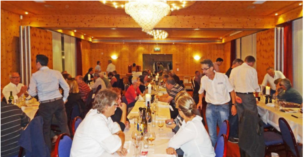
Nach der Versammlung gab es genügend Gelegenheit für angeregte Gespräche