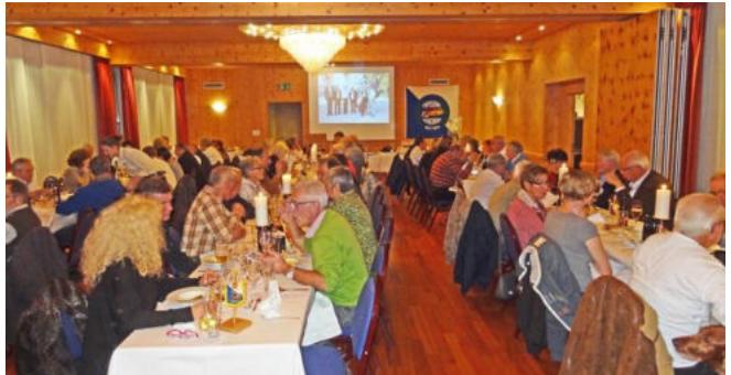
Vor der Versammlung wurde das Nachtessen serviert, während dem eine Diapräsentation vom internationalen Treffen und der anschliessenden Reise lief