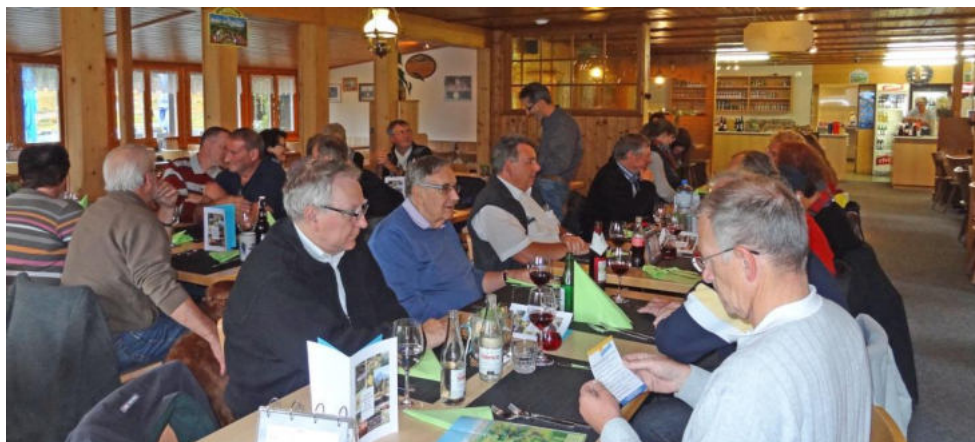
In der heimeligen Wirtschaft auf der Wolzenalp

Die Teilnehmenden suchten sofort nach Verlassen der Autos die angenehm warme Wirtschaft auf und man setzte sich an die für uns gedeckten Tische. Kurz nach der Getränkebestellung wurde der Salat serviert und das Menü (ausgezeichneter Hackbraten an Rotweinsauce mit Kartoffelstock und Bohnen) folgte auch schon bald. Wer nach der wirklich grossen Portion des Hauptgangs noch Lust auf Dessert hatte – und das waren doch noch einige – bestellte entweder einen Coupe oder einen „Schlorzifladen“ eine Spezialität aus dieser Region.