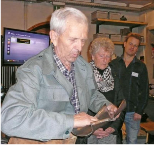
Das Blech für eine Treichel wird geformt

Man musste absolut kein Musiker sein, um den Unterschied der Klänge der Schellen und Glocken sofort zu erkennen, dass die einen fast „schäpperten“, andere einen kurzen, dumpfen Ton hatten, und von edleren Glocken der Klang noch länger im Ohr nachhallte.