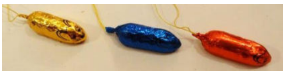
Eine süsse „Topolino-Kolonne“