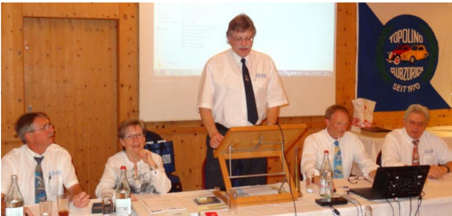
Der Vorstand in Aktion