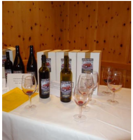
Für einmal konnte der Clubwein vor dem Kauf degustiert werden