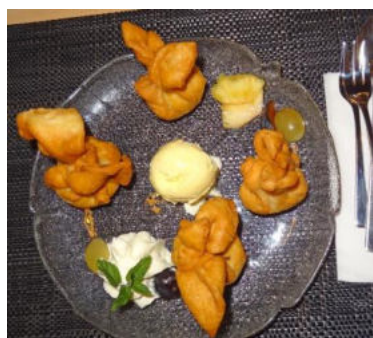
Das exklusive Schlorzifladen-Dessert