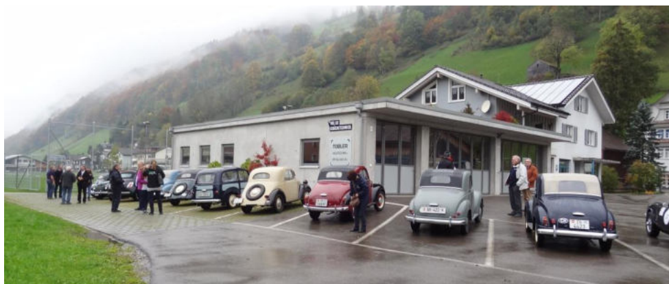
Parkplatz bei der ehemaligen Mühle

Der Wetterbericht klang nicht sehr verheissungsvoll für den 18. Oktober: „vereinzelt Regen und kühl“ wurde vorausgesagt. Kühl war es, sogar kalt und Regen fiel auch, leider nicht nur vereinzelt, sondern ziemlich flächendeckend und langanhaltend. Das war für die meisten Teilnehmer aber kein Hindernis, trotzdem mit dem Topolino zum vereinbarten Treffpunkt auf der Hulftegg zu erscheinen, wo sich die Teilnehmenden bei Kaffee oder Tee aufwärmen konnten. Leider haben sich einige am Sonntagmorgen noch ganz kurzfristig abgemeldet und zwei sind einfach so nicht erschienen. Dennoch waren wir eine stattliche Gruppe, die von der Hulftegg über Mosnang, Bütschwil, Lichtensteig, Ebnat Kappel, Nesslau nach Alt St. Johann im Toggenburg fuhr. Auf kleinen Nebenstrassen wand sich der Topi-Konvoi dem Hang entlang, bergauf und bergab, fernab der teilweise stark befahrenen Strasse durch das Toggenburg. Nicht nur uns passte das garstige Wetter nicht, auch den Topis machte die Kälte etwas Mühe, und es zeigten sich bei einzelnen Anzeichen von Vergaservereisungen.