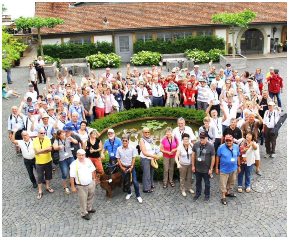
Schlussbild Internationales Treffen 2015 Auf Wiedersehen 2016 in Turin