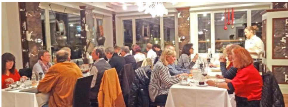
Im schönen Säli im Restaurant Sonnental geniessen die Mitglieder das Nachtessen

Bereits am 1. Dezember musste diesmal der Samichlaus raus, um die Topiclubmitglieder treffen zu können. Im Stammlokal im Restaurant Sonnental wurde uns für diesen Anlass extra ein Säli reserviert, wo wir genügend Platz hatten. Kurz nach 20 Uhr polterten dann laut läutend der Samichlaus mit Schmutzli in den Raum und wiederum haben die anwesenden Clubmitglieder mit selbstgedichteten Versli oder solchen aus dem Internet dem Samichlaus und seinem Schmutzli eine Freude gemacht. Als Dank erhielten alle ein Säckli mit selbstgemachten Guetzli.