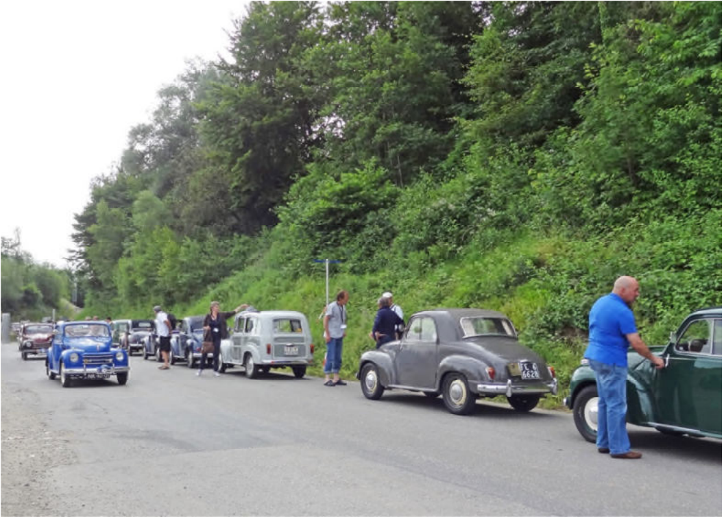
Im Hunzikerareal in Brugg durften die Topolinos parkiert werden und zu Fuss machte man sich auf den Weg zum Bahnpark