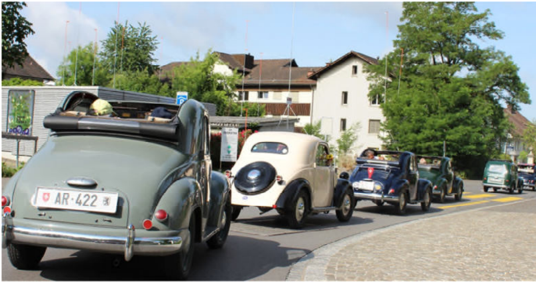
Auf der Fahrt um den Hallwiler- und Baldeggersee...