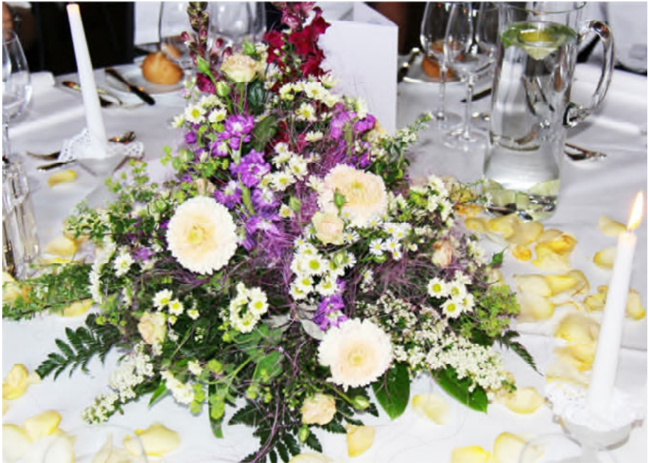
Die wunderschöne Tischdekoration Die Gäste haben an den runden Tischen Platz genommen