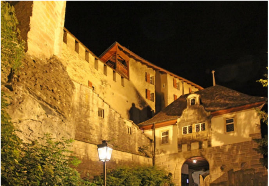
Schloss Lenzburg by night