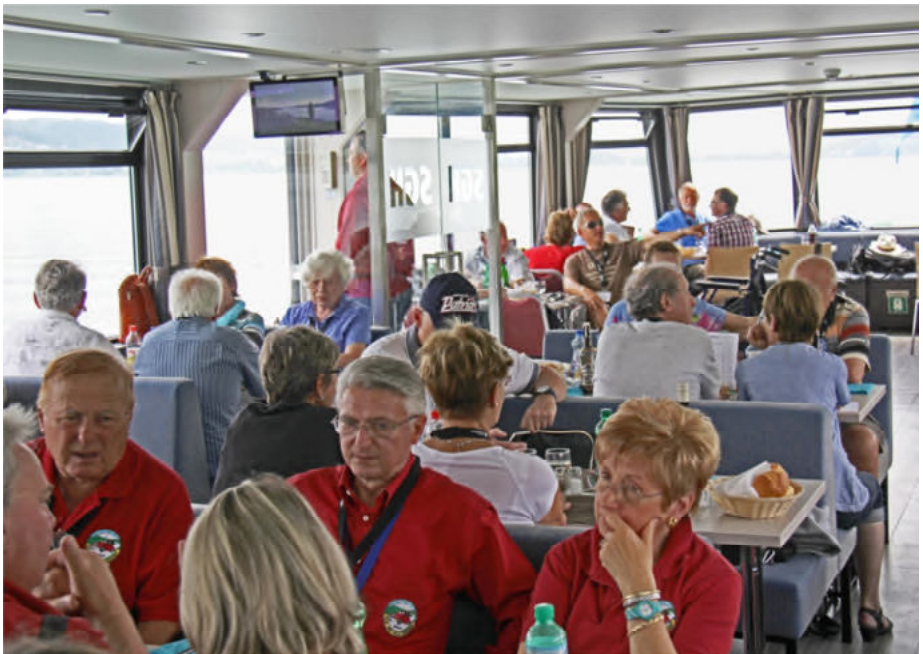
in der unteren Etage...