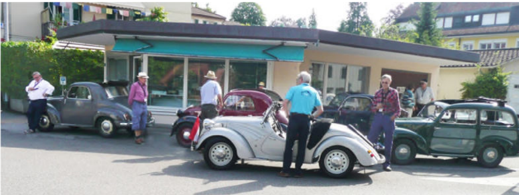
Warten auf den Start zur Fahrt um den Hallwiler- und Baldeggersee nach Meisterschwanden