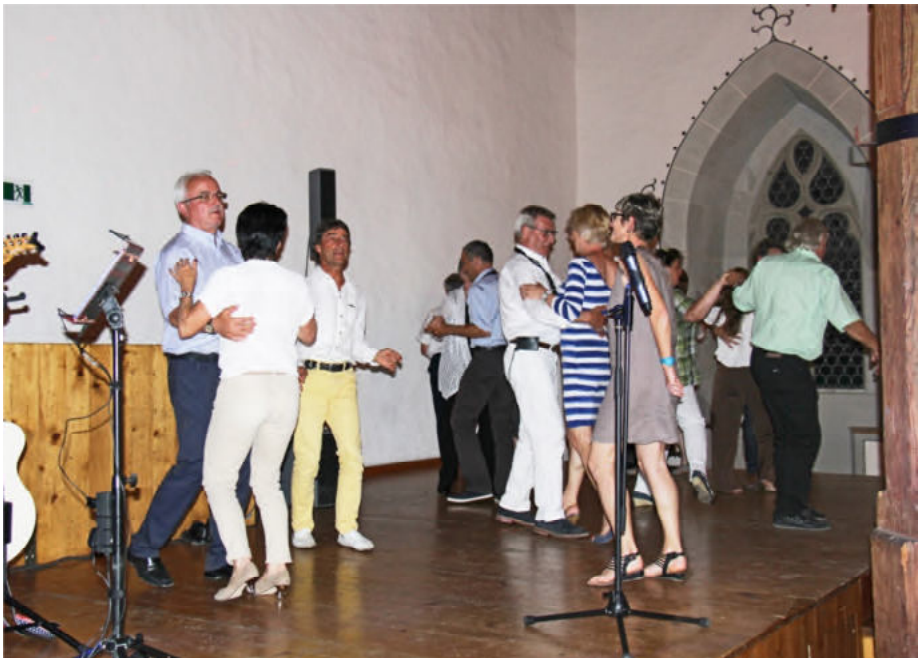
Gegen Ende des Abends wurde auch noch das Tanzbein geschwungen