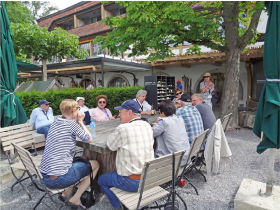
In der schattigen Gartenwirtschaft wartet man bis zur Ankunft des Schiffes