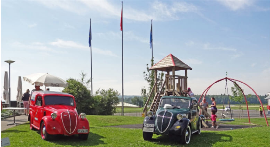
Die Spezialfahrzeuge (Ramazzotti-Topolino und Topolino-Elektromobil von IMAG) stehen zum Bestaunen bereit