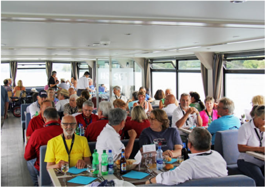
Beim Mittagessen auf dem Schiff...