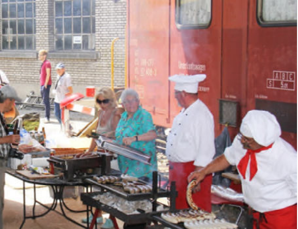
Der Andrang am Grillstand nach der Fahrt war gross