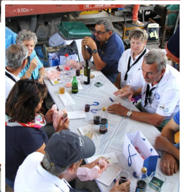
Sitzgelegenheiten gab es im Freien oder im Bahnpark