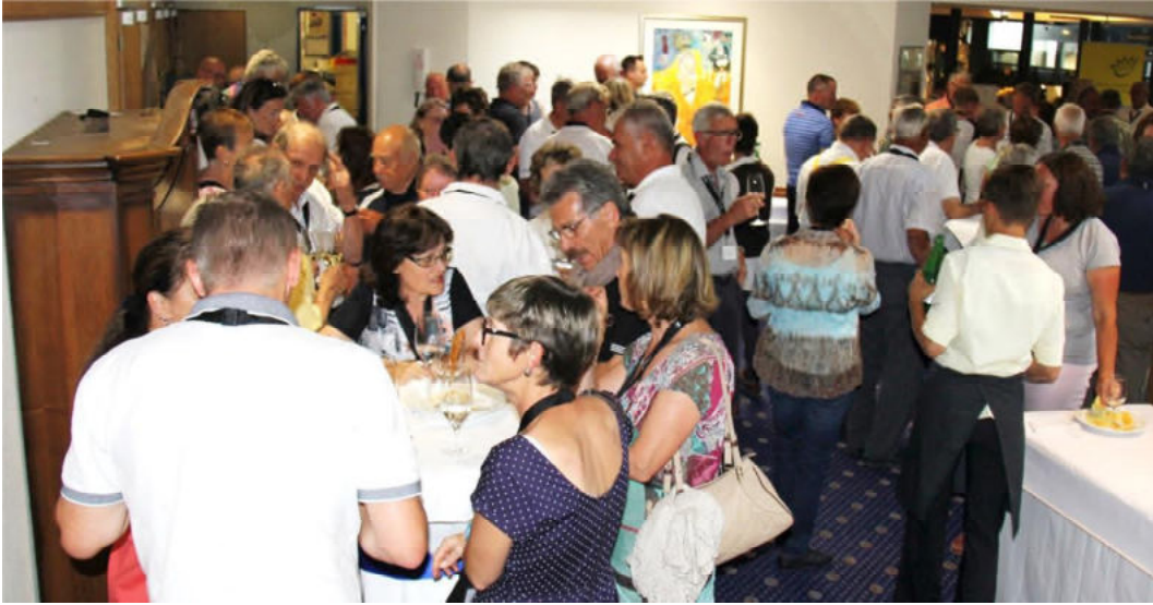
Angeregte Gespräche beim Apéro vor dem Nachtessen