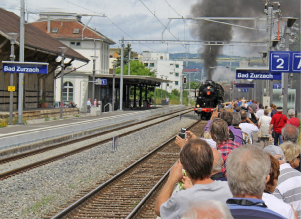
Fotohalt in Bad Zurzach... ...mit „Scheinanfahrt“ des Dampfzuges