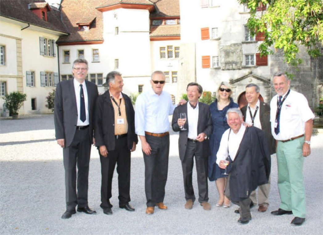
Die Präsidenten der Topolinoclubs gaben sich ein Stelldichein Langsam begab man sich dann zum Rittersaal