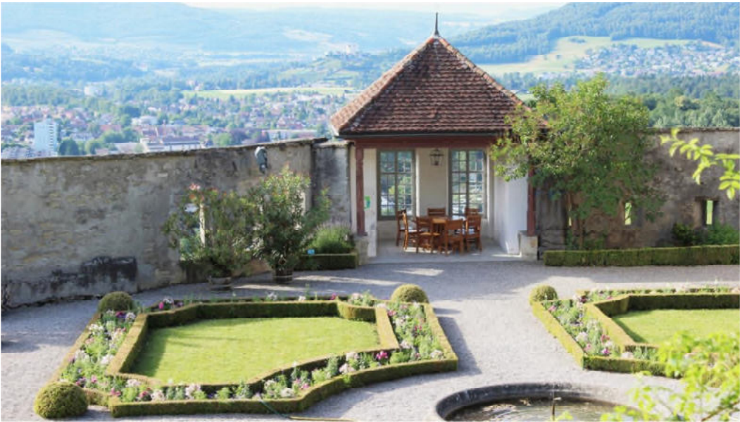
Schlosspark mit Sicht auf Lenzburg