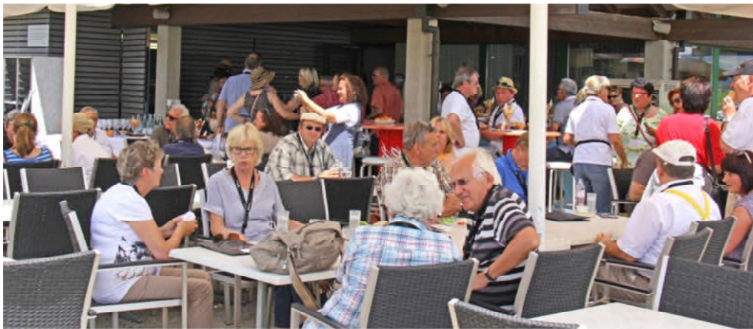
Die bunte Gästeschar auf der Terrasse des Restaurants Birrfeld