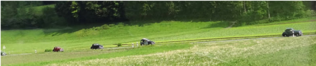
...zum Parkplatz beim Hotel Seerose in Meisterschwanden