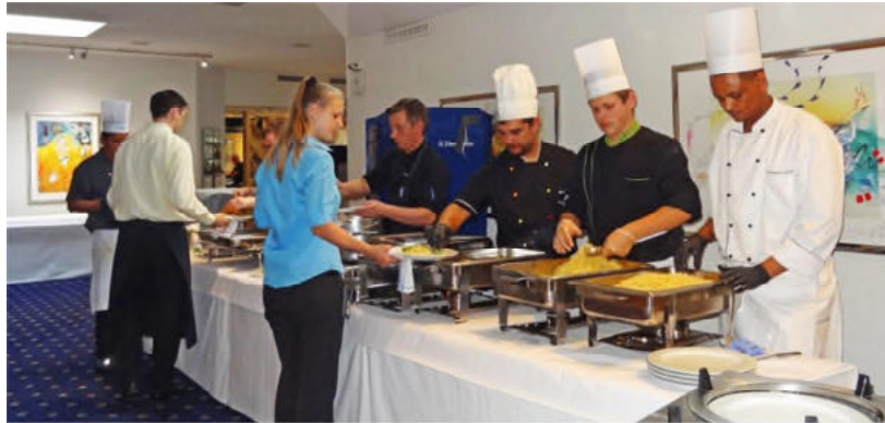
Gemeinsames Nachtessen im Saal des Hotels Krone, Lenzburg