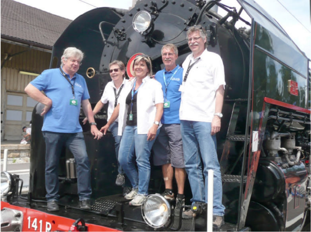
Auch das OK-Team liess es sich nicht nehmen, vorne auf der Lok für ein Bild zu posieren