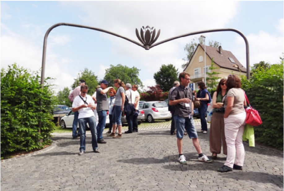
Eingang zum Hotel Seerose