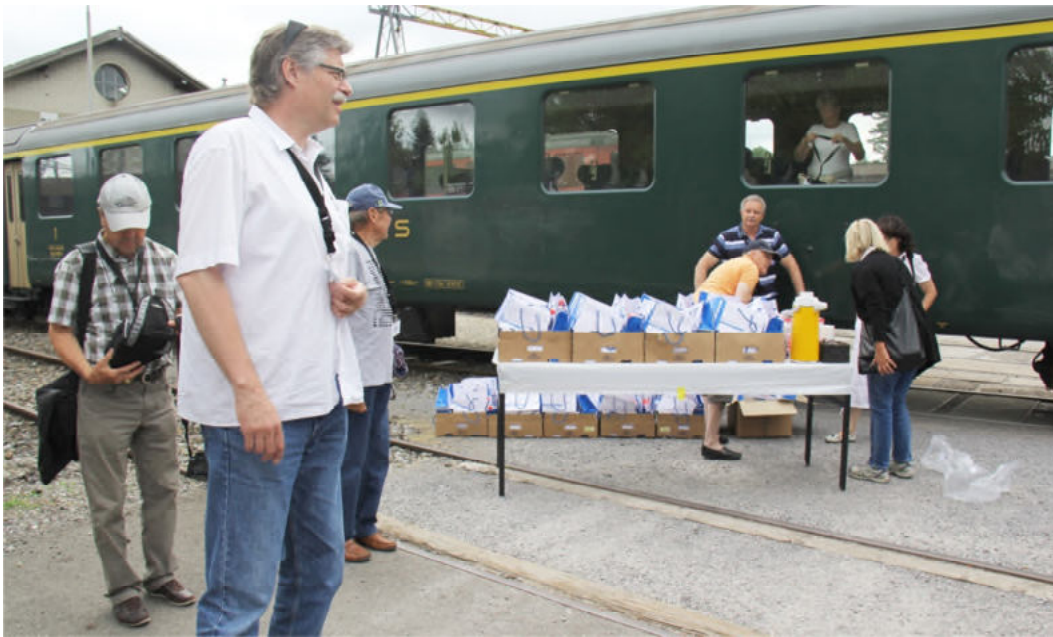
In Brugg bereiteten inzwischen fleissige Leute die Lunchsäcke vor und vor der Zugsabfahrt konnte man sich noch mit Kaffee eindecken