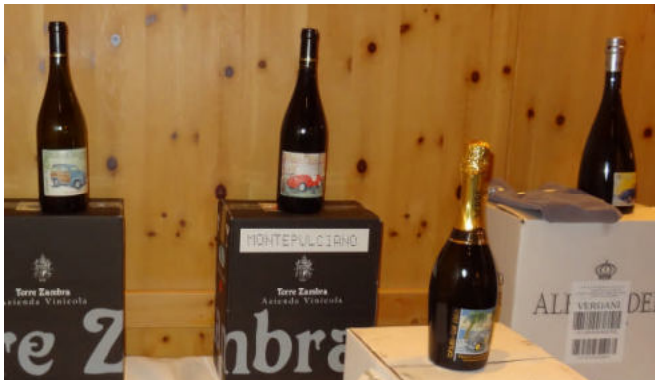
Wein-, Prosecco- und Grappa-Flaschen mit neuen Topi-Etiketten warten auf ihre Käufer