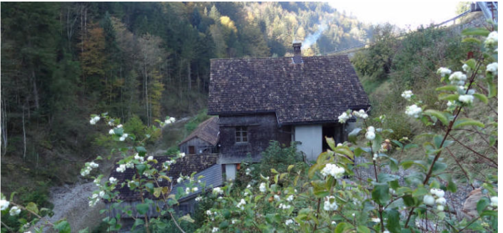
Die alte und schattig gelegene ehemalige Drechslerei und heutiges Museum

Um 11:00 Uhr kamen wir beim Drechslerei-Museum an, dort erwartete uns ein Apéro und eine Führung.