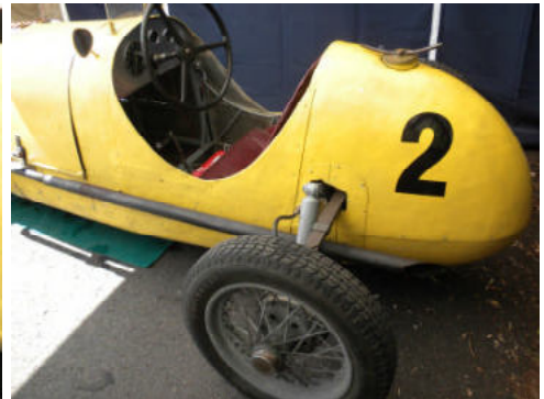
Spartanisch und eng ist das Cockpit.

Die Grundkomponenten dieses Wagens stammen aus verschiedenen Fabrikaten. So ist das Chassis ein Eigenbau, der Motor stammt vom Fiat Topolino B, die Vorderachse aus einem DKW, das Getriebe aus einem VW Pullmann und der Antrieb