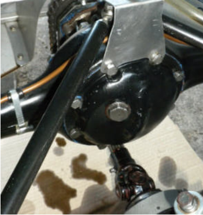
Der Antriebsstrang mit Hinterachse um 180° gedreht, Getriebeausgangswelle unter dem Differenzial liegend und mittels Kettenräder und Kette führt auf die höher liegende Welle des Differenzials.

Maurice, einer der Fahrer, hat bereits ein zweites Projekt um auf einem vorhandenen Chassis einen weiteren Formel 3 aufzubauen, diesmal jedoch mit Motorradmotor der auch italienisch sein soll, nämlich von Gilera. Dazu konnte ich, dank meiner häufigen Besuche am Ersatzteilmarkt in Novegro/Mailand, gleich die Adresse des Motorenherstellers in Italien, der Gileramotoren aus der damaligen Zeit neu herstellt, vermitteln.