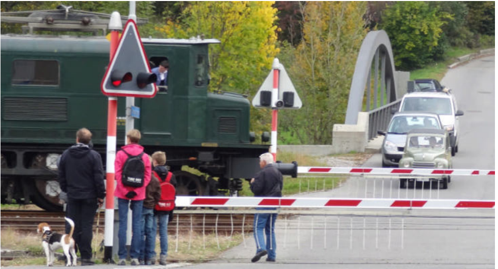
In Bauma wurde der letzte Topi durch eine historische Lock, die die Strasse überquerte, aufgehalten