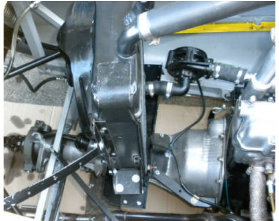
Interessante Mechanik der Gangschaltung wenn das Getriebe hinten sitzt und ab dem Fahrercockpit mit Schalthebel bedient sein will.