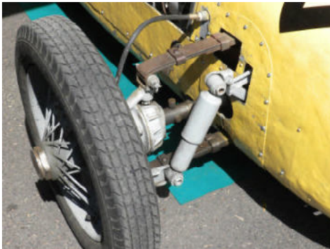
Vorderachse mit Frontantrieb.