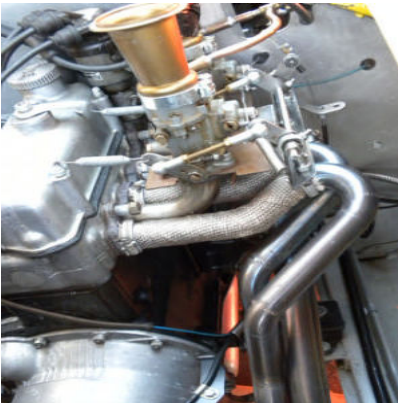
Kunstvoll geformte Auspuffkrümmer am Topi-Rennmotor.