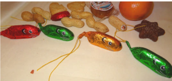
Die etwas andere «Topolino»-Kolonne