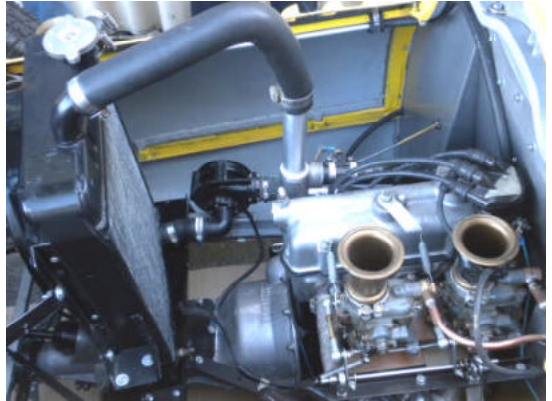
Der Topolino-Motor als Mittelmotor hinter dem Fahrersitz und der Kühler hinter dem Motor. Die Doppelvergaser sind für den Renneinsatz selbstverständlich. Man beachte die Wasserpumpe für ausreichend Kühlleistung im Renneinsatz.