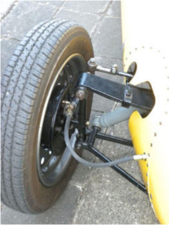
Die Vorderachse aus dem Topolino.