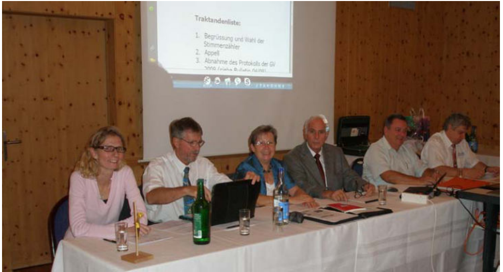
Der Vorstand im Einsatz während der GV 2010