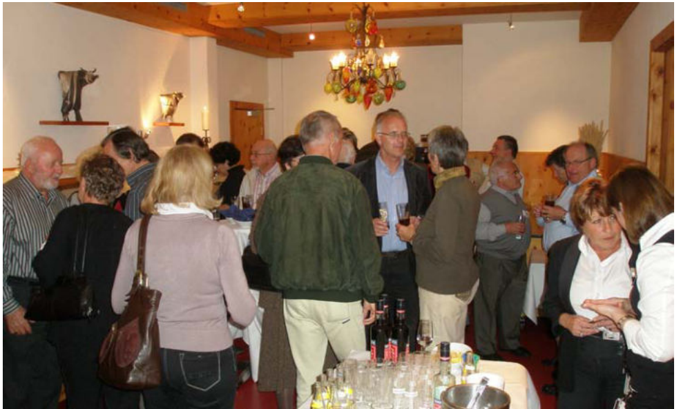
Mitglieder und Gäste beim Apéro