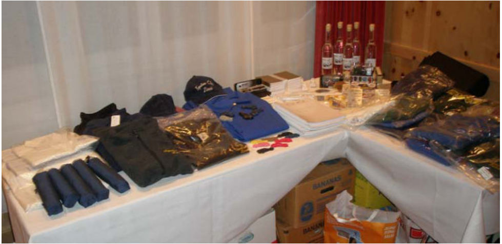
Die Auslage der zum Verkauf angebotenen Clubartikel