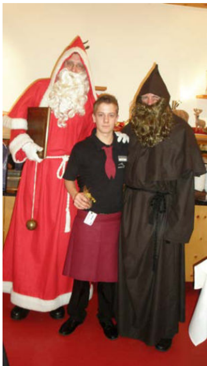
Samichlaus und Schmutzli mit dem sympatischen Kellner im Sonntal

Der Samichlaus hat die «Spick-Zettel» der Sprücherezitierenden alle eingesammelt und der Redaktion für den Abdruck im Bulletin übergeben, was hiermit auch geschieht. Es gab natürlich auch Mitglieder, die brauchten für ihr Sprüchli keinen Spick, daher können diese leider nicht abgedruckt werden.