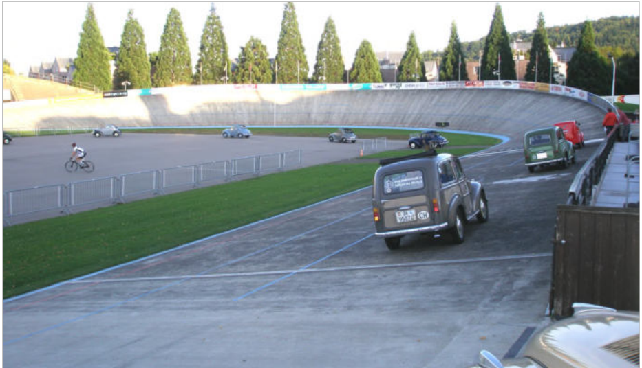
Die Einfahrt der Topolinos ins Innere der Rennbahn Zürich-Oerlikon