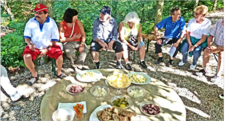
Im angenehm schattigen Garten der Schlosschenke beim Apéro