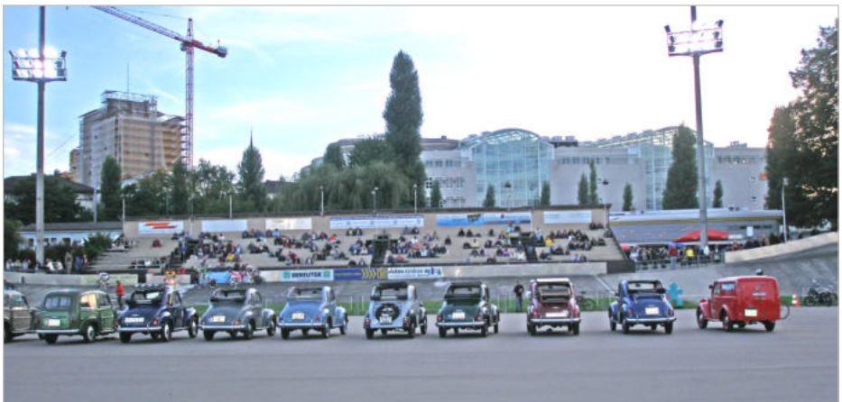
Die aufgestellten Topolinos, im Hintergrund die eher schwach besetzte Tribüne

Da es sich um das zweitletzte Rennen auf der offenen Bahn in dieser Saison handelte, war der Publikumsandrang nicht mehr sehr gross, vielleicht auch, weil an diesem Abend keine Steherrennen stattfanden?