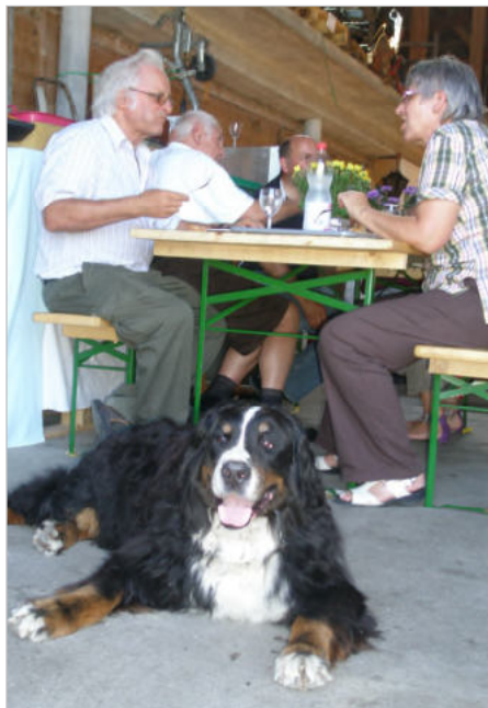
Die drei Gastgeber