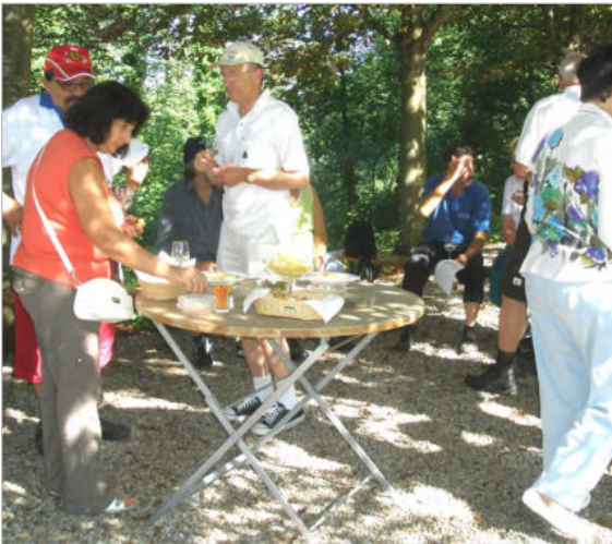
Geladene Gäste ...