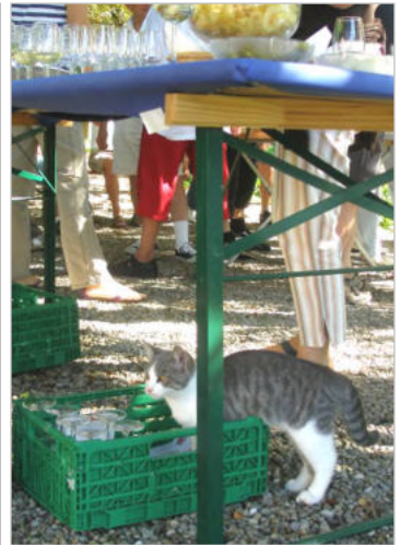
... und ein ungeladener Gast

Bald geht es von Elgg weiter durch Ortschaften, deren Namen wir teilweise noch nie gehört haben: Schneit → Stegen → Liebensberg → Kefikon TG → Ellikon a.d.Thur → Altikon. Wir fahren durch idyllisch gelegene kleine Bauerndörfer – immer wieder winken uns Spaziergänger zu. Weiter geht's via Niederneunforn → Farhof → Gütighausen → Hettlingen → Aesch nach Pfungen.