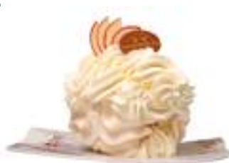
E gluschtigi Riise-Merängge