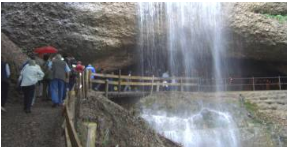
Der imposante Wasserfall vor dem Eingang zur Höhle

Nach Zimmerbezug, Erfrischung und Relax erwarteten uns die Organisatoren des Topi-Clubs Innerschweiz um 18.15 bei der Rigibahn in Vitznau. Die Zahnradbahn transportiere uns bis zur Station Gruebisbalm. Von dort aus, einige Schritte zu Fuss, in die Höhle Gruebisbalm. Die Höhle war mit romantischem Kerzenlicht beleuchtet, aber halt ein wenig feucht.