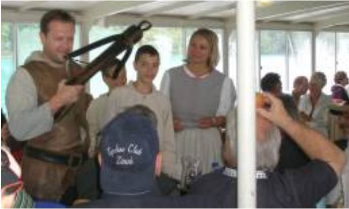
Besuch der "Tell-Familie" auf dem Schiff

Auf dem Schiff erhielt jeder Teilnehmer ein Lunch-Säckli für die ganze Fahrt. Das Dampfschiff Uri dampfte von Brunnen nach Flüelen, am Rütli und der Tellsplatte vorbei. Wieder zurück in Brunnen, fuhren alle Topi von Brunnen nach Vitznau zurück. Jedermann/frau konnte sich dann ins Hotel zurückziehen, damit sich alle schön machen konnten für den bevorstehenden Gala-Abend im Hotel Flora-Alpina – dem Highlight des Abends.