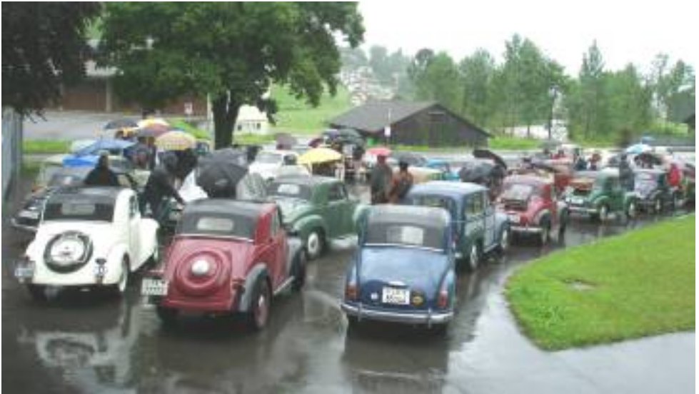
Parkieren etwas ausserhalb von Brunnen und dann ging es zu Fuss weiter zur Schiffsstation