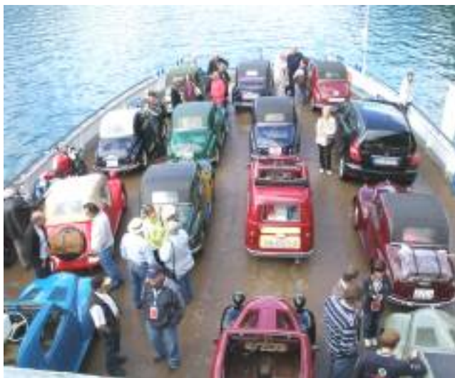
Überfahrt von Gersau nach Beckenried

Ach, wie schön, nur noch graue Wolken hingen am Himmel. Der Regen verliess uns endlich. Ein feines Frühstücks-Buffet – wieder mit voller Sicht auf den See – war für uns aufgetischt worden. Programmgemäss traf man sich beim Fährehafen in Gersau. Die Fähre brachte uns ohne grosse Wellen dafür mit etwas Sonnenschein von Gersau nach Beckenried.