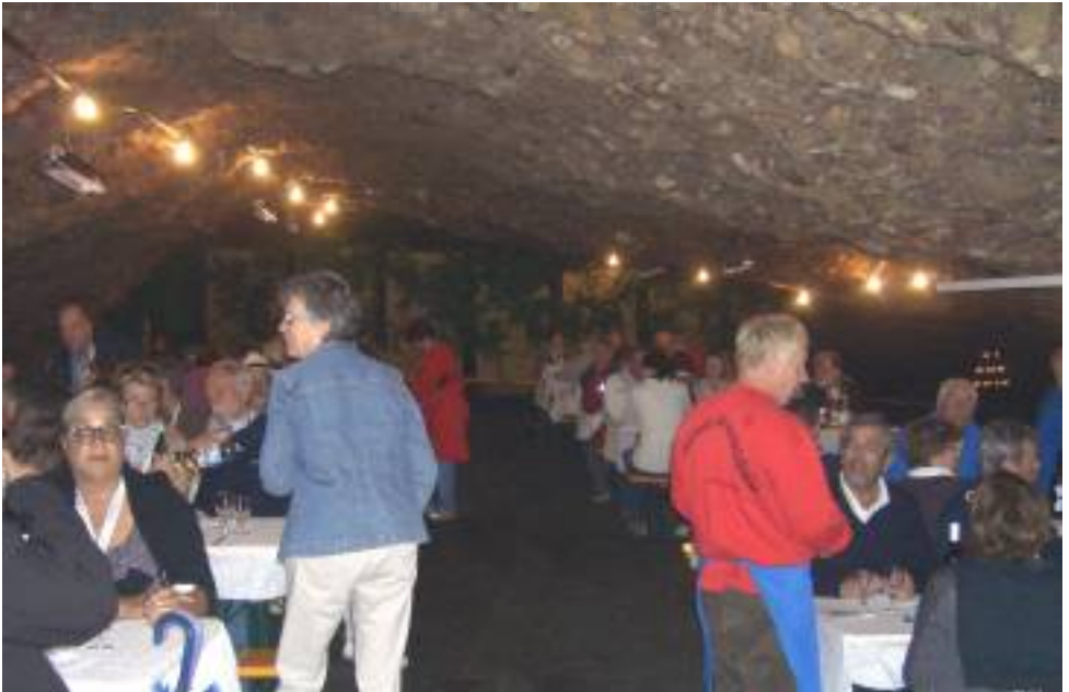
Die Gäste beim Essen in der Höhle

Wir wurden mit Schweizer Spezialitäten verköstigt. Salat, Äplermaccaronen oder Ghacks mit Hörnli und einem frischen Fruchtsalat oder Caramelköpfl. Nun begann es draussen zu regnen und es wurde noch feuchter in der Höhle, was zum Aufbruch veranlasste. Zurück nach Vitznau, mit einem Abstecher über Rigi Kulm, wurden alle mit Kleinbussen in ihr Hotel zurückgeführt und konnten eine warme und erholsame Nacht geniessen.