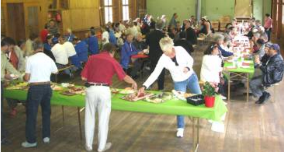
Das kalte Buffet fand Anklang