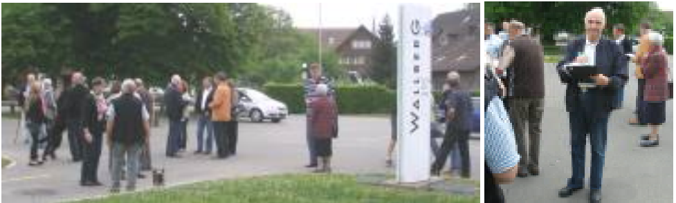
Beim Treffpunkt in Volketswil