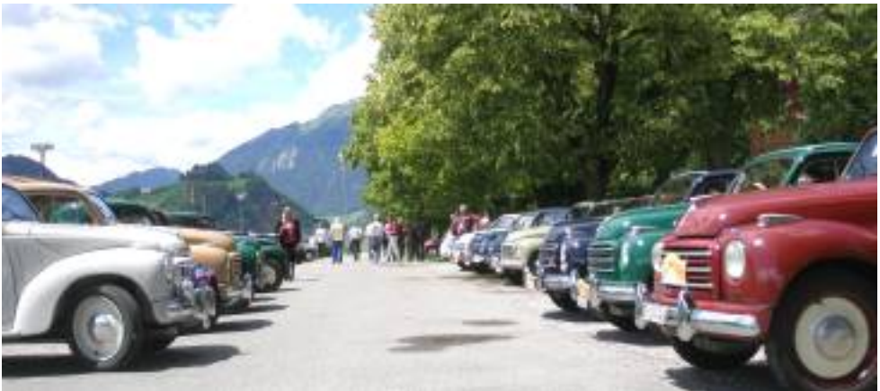
"Topolino-Parade" vor dem Schützenhaus Stans