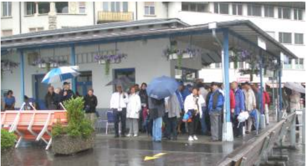
Am Schiffssteg in Brunnen: Warten auf das Dampfschiff