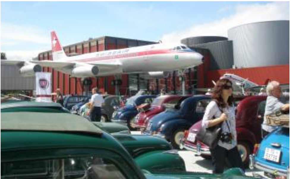
Topolinos vor imposanter Kulisse

Bevor wir den offiziellen Apéro geniessen durften, wurden in der neuen Halle "Strassenverkehr" fünf Topolinos aus verschiedenen Epochen vorgestellt. Von un-