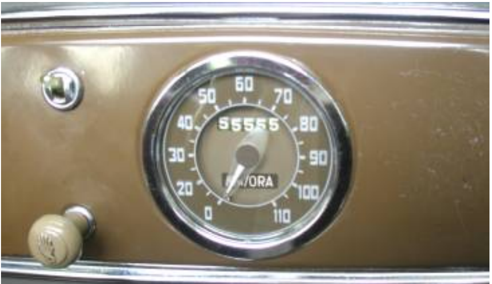
55 555 –ein "Schnapszahl"-Kilometerstand