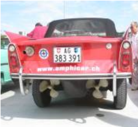
Einer der beiden Amphicars