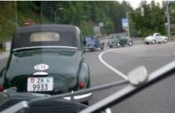
Warten vor dem Rotlicht