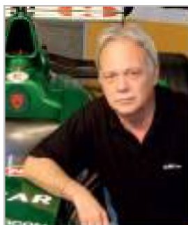
Überzeugen Sie sich selbst! Das Belmotel auf dem Gelände des ehemaligen Cavaliere-Platzes, Real Estate Schweiz.