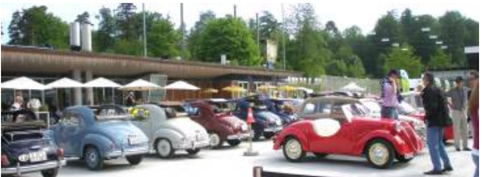
Blick auf das Gelände