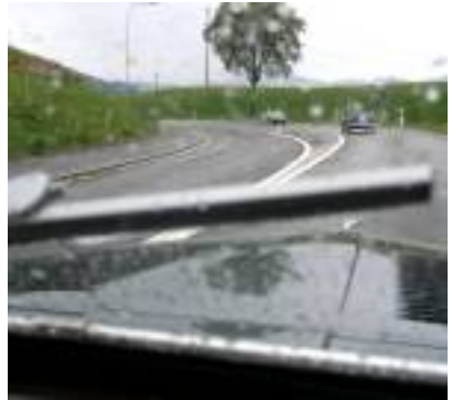
Die Topis wurden auch noch nass

Die anschliessende Fahrt durch das Neckertal im frischen Grün des Frühlinglaubes war ein Genuss, besonders auch, weil sich inzwischen vermehrt die Sonne zeigte. Da an diesem Sonntag in Appenzell noch Landsgemeinde war und die Restaurants deshalb ausgebucht waren, fuhren wir in ein malerisches Tal, etwas ausserhalb nach Lehmen. Dort genossen wir genossen einen leckeren Apéro.