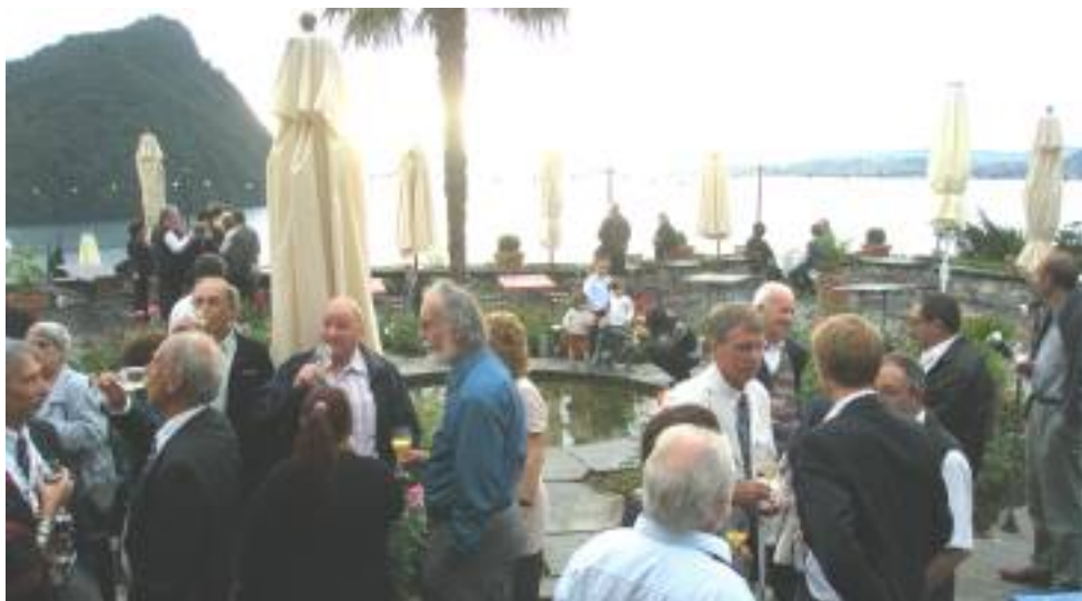
Apéro auf der Hotelterrasse

Auf der grossen Gartenterrasse mit wunderschönem Ausblick auf den Vierwaldstättersee wurden wir mit einem feinen Apéro empfangen. Samllitalk, Topi-Gespräche und rege Unterhaltung mit Italienern und Deutschen stimmten auf den bevorstehenden Gala-Abend ein.