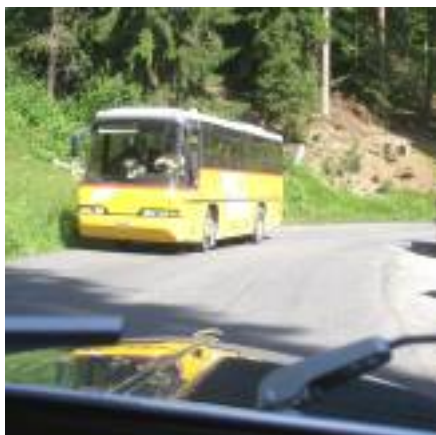
Enge Strassen auf der Fahrt nach Chur erschweren das Kreuzen