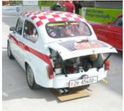
Der vielbeachtete Fiat-Abarth

Das Wetter machte auch mit. Die Sonne schien – trotz ein paar vorüberziehenden Wolkenfeldern – schön warm und machte auch durstig. Der im "Begrüssungspaket" beigelegte Gutschein für ein Cüpli wurde natürlich von allen gerne eingelöst. Eine etwas derbe Überraschung erlebten jene, die sich einen Salat vom Buffet schöpften und eine Wurst dazu bestellten, sie mussten einen – für unser Empfinden – ziemlich überzogenen Preis dafür bezahlen. Da es Muttertag war, war man aber fast gezwungen, vor Ort etwas zu essen, denn in den umliegenden Restaurants war kein Platz für unsere Gruppe mehr zu finden.