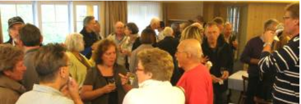
Angeregte Diskussionen beim Apéro

Die anschliessende Fahrt durch das Neckertal im frischen Grün des Frühlinglaubes war ein Genuss, besonders auch, weil sich inzwischen vermehrt die Sonne zeigte. Da an diesem Sonntag in Appenzell noch Landsgemeinde war und die Restaurants deshalb ausgebucht waren, fuhren wir in ein malerisches Tal, etwas ausserhalb nach Lehmen. Dort genossen wir genossen einen leckeren Apéro.