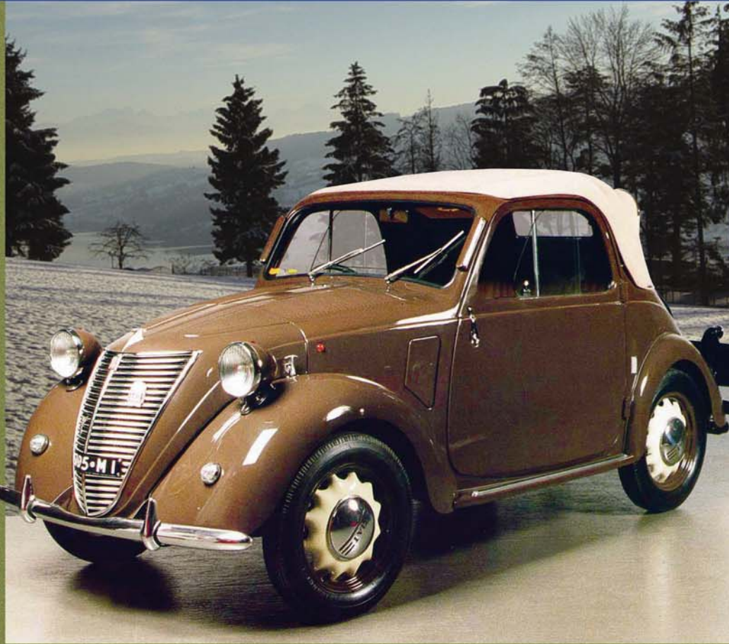
FIAT 500 - GARAVINI 1938